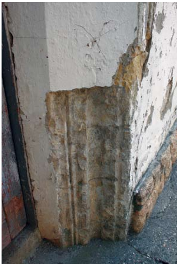
Sl. 5 Marčan, župna crkva sv. Marka, ulazni portal u toranj

profilacije, kapitelu polustupa i fragmentu polustupa. 7 Ovi dijelovi arhitektonske dekoracije izrađeni su od vapnenca, predstavljaju dio starije crkve srušene u 19. stoljeću, a datirani su u početak 13. stoljeća. 8