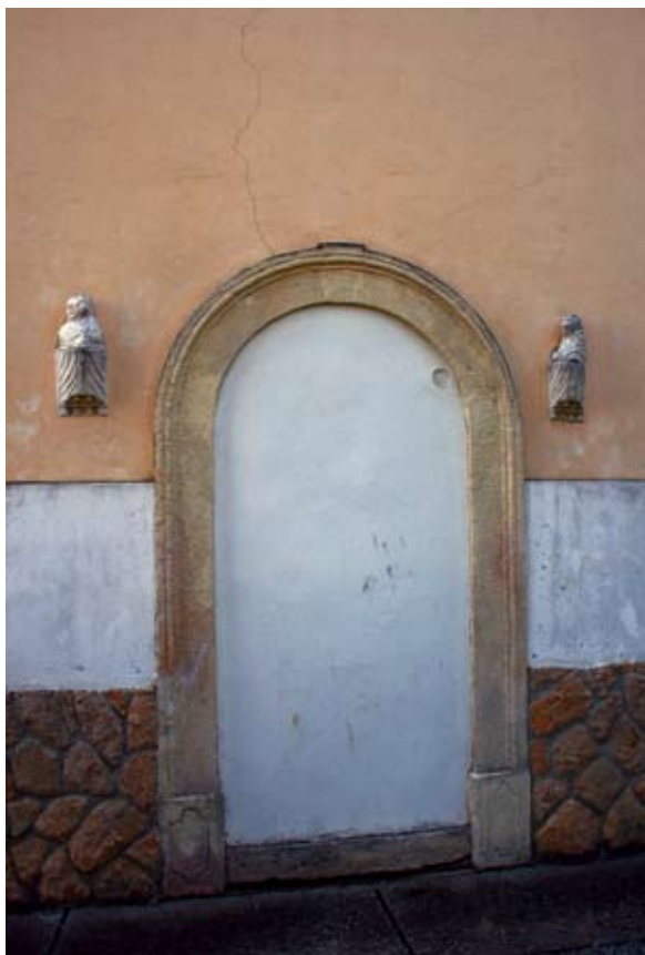
Sl. 6 Marčan, župna crkva sv. Marka, lavić na pročelju