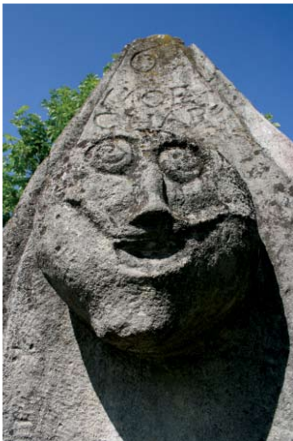
Sl. 11 Vinica, Pranger, detalj glave s bočne desne strane stupa, autor: Vesna Pascuttini – Juraga

obljenijeg oblika. Također završava blagom istakom na sredini tjemena. Iznad glave ispisan je tekst MOE CHAB te iznad toga brojka 6. Glava s desne strane po obliku i obradi nalikuje glavi s lijeve strane i sličnih je dimenzija (visina 27 cm, širina 25,5 cm, dubina 18,5 cm). Iznad glave upisano je DS IIOI , te iznad toga brojka 1(I). Uklesani brojevi mogli bi se interpretirati kao godina 1643. Prema pričanju lokalnog stanovništva stup se nazivao i “kara”. Bio je to strup sramote za koji su se prikivali “zlotvori” i oni koji su se služili “krivom mjerom” tj. trgovci koji su varali na mjeri, a također i “svadljive i jezičave” žene. Kamena posuda, mjera upotrebljavala se kao mjera na nedjeljnim sajmovima, što znači da je stup imao dvojaku funkciju: kao zakonska mjera i za sramotno izlaganje.