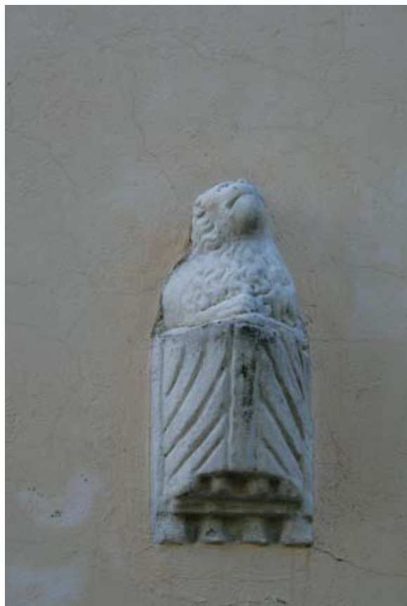
Sl. 7 Marčan, župna crkva sv. Marka, lavići na pročelju

desetak kilometara južno od Vinice. Skulpture lavića u Ivancu danas nose renesansni bazen krstionice te su na taj način ponovno u uporabnoj funkciji. 12 Ove skulpture očuvane su kao puna plastika, a sličnost s lavićima u Vinici vidljiva je u pristupu prikazu glave, ekspresije i grive; no lavići iz Ivanca manje su statični i također imaju naglašeniji ekspresionizam. 13