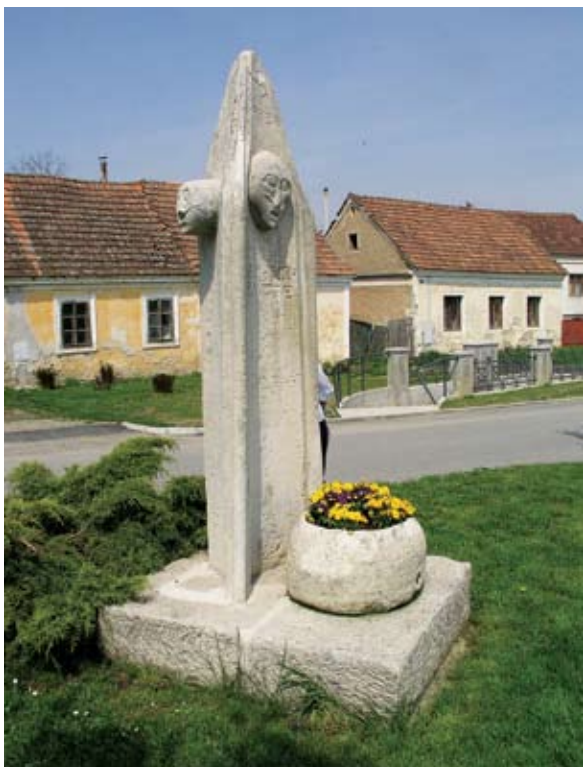
Sl. 8 Vinica, Pranger, autor: Vesna Pascuttini – Juraga

su kažnjavani lopovi, ali i svi koji se nisu ponašali u skladu s moralom. Kažnjenici su obično bili vezani uz stup od jutra do večeri, bez hrane i vode, a prolaznici su ih ismijavali, vrijeđali, gađali ih smećem i sl.