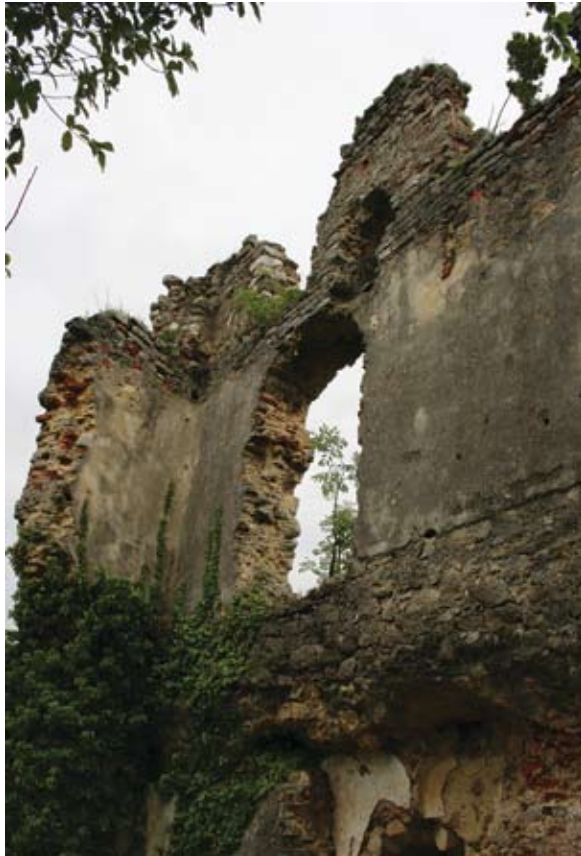
Sl. 3 Vinica, vanjsko zide utvrde

no je koncipiran i vanjski obrambeni prsten, sa četiri obrambene kule. 4