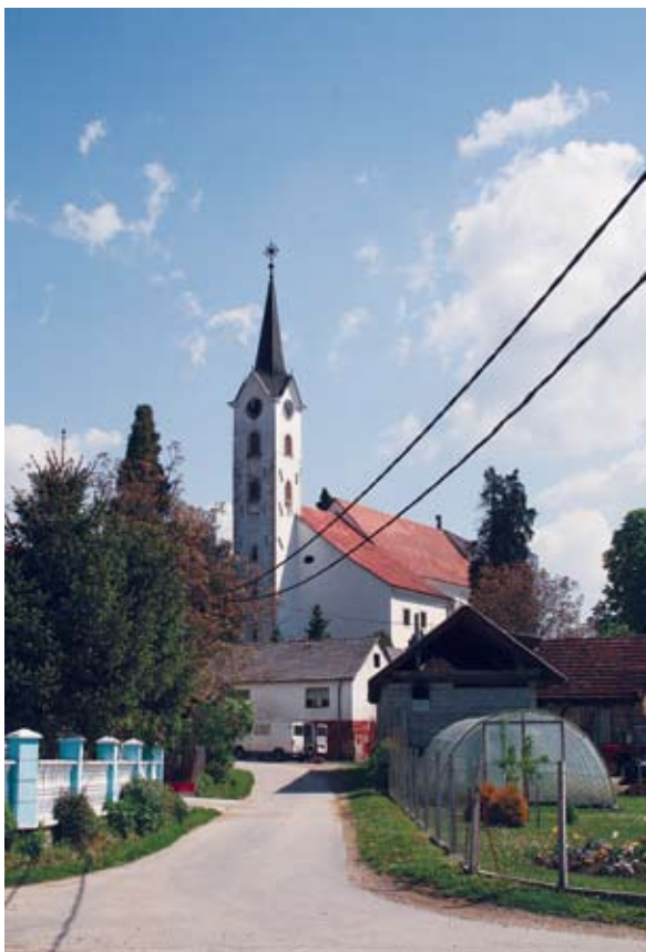
Sl. 4 Marčan, župna crkva sv. Marka