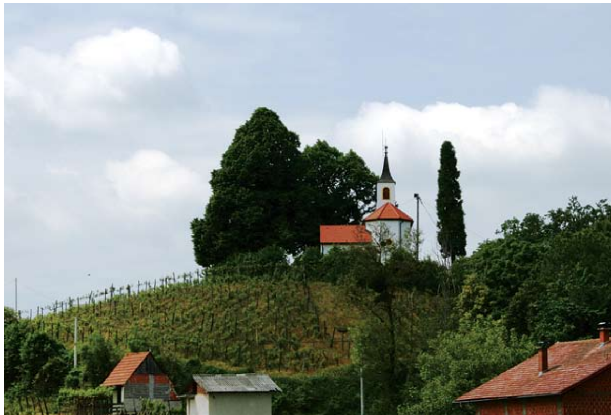
Sl. 1 Kapela Uznesenja BDM, Malo Gradišće