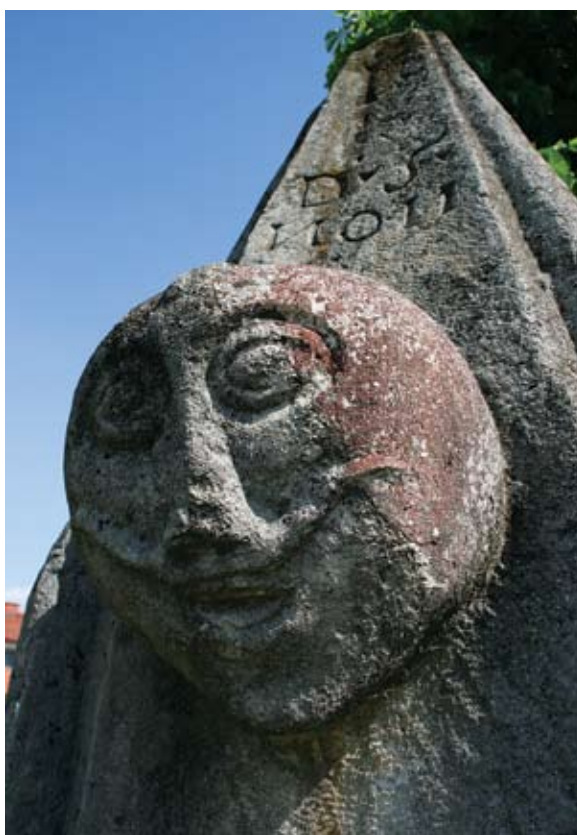
Sl. 10 Vinica, Pranger, detalj glave s bočne lijeve strane stupa

lica spušta ispod nosnica i tada se naglo uvija prema gore s druge strane lica. Zanimljiva je i istaka na samom vrhu glave, koja po obliku podsjeća na 'Irokez' frizuru ili ukras sličnog oblika. Ispod glave uklesan je tekst na latinskom: IVSTAM MENSVR(AM) TENETE, mjerite pošteno . Na vrhu stupa je, iznad glave, uklesan broj 43 i EZE . Muška glava s lijeve strane nešto je manjih dimenzija od prednje (visina 24,5 cm, širina 25 cm, dubina 18 cm), ali je jače izbočena iz stupa (sl. 10). Također ima vrlo dominantne okrugle oči, spljošten trokutast nos te ponovno asimetričan brk iznad otvorenih urezanih usta. Glava je nešto za-