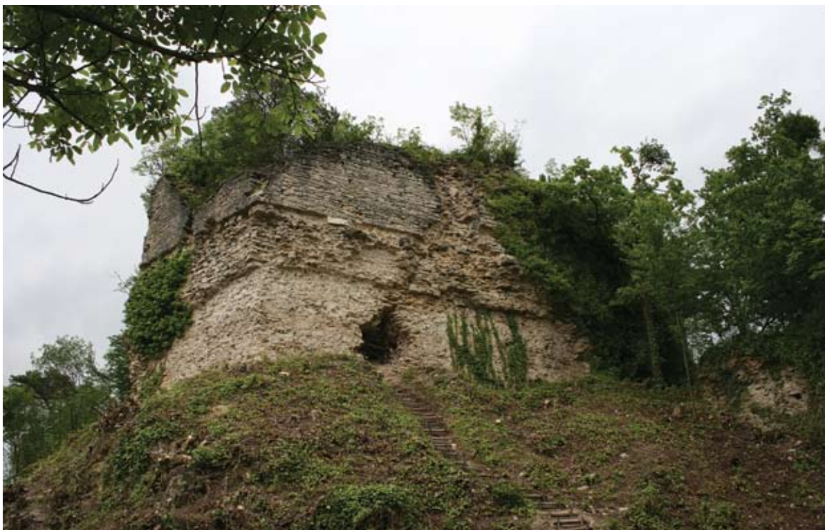
Sl. 2 Vinica, središnji dio utvrde

slije toga utvrda često mijenja vlasnike te je tijekom vremena bila znatno nadograđivana. Značajno je da su vlasnici bili redom iz kraljevskih ili grofovskih, uglavnom visoko pozicioniranih i utjecajnih obitelji. Utvrda je s krajem srednjovjekovnog razdoblja izgubila na strateškoj važnosti, napuštena je, te se već u 17. stoljeću spominje kao ruševna. Činjenica da je utvrda u određenom razdoblju bila kraljevski posjed ostavila je vjerojatno trag na njoj, kao i na crkvi pod njezinim patronatom, u ovom slučaju crkvi sv. Marka u Marčanu. Jezgru utvrđenja, njegov najstariji i najupečatljiviji dio čini središnja peterokutna građevina, na kojoj se usprkos oštećenjima razaznaje čvrsta gradnja debelih zidova, bez ikakvih otvora u donjim zonama (sl. 2). Prvo je to bila samostalna građevina, koja je poslije nadograđena i opasana novim zidinama renesansne forme. Najstariji dio, odnosno središnja građevina peterokutnog tlocrta, prati konfiguraciju terena te je izdužena u smjeru sjever – jug. Vanjsko lice zida očuvano je samo u gornjim zonama očuvanog dijela građevine. Za zidanje vanjskog lica korišten je kamen koji je priklesavan kako bi se dobili kvadratični oblici. Tako klesani blokovi slagani su u pravilne redove nejednake debljine. Unutrašnjost zida ispunjena je komadima kamena lomljenca različite veličine, vezivnim materijalom i manjom količinom cigle. U unutrašnjosti je vidljivo lice zida te rupe od greda koje su nosile strop. Koliko etaža je ovaj dio utvrde sveukupno imao, za