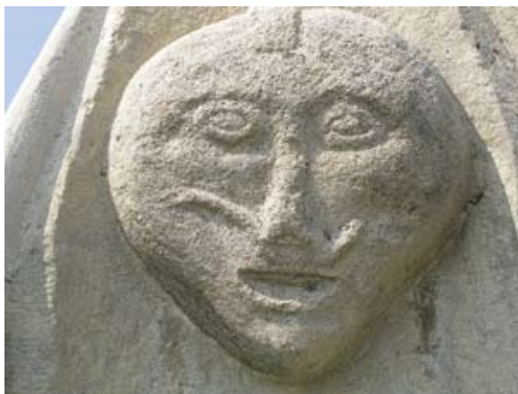
Sl. 9 Vinica, Pranger, detalj glave s prednje strane stupa, autor: Vesna Pascuttini – Juraga

U gornjem dijelu stupa, sa sve tri strane, na visini od 170 cm, nalazi se po jedna glava muškarca s brkovima koja gotovo u punom profilu izlazi iz površine stupa. Središnja muška glava najvećih je dimenzija (visina 38 cm, širina 33 cm, dubina 8,5 cm) i izvedena je najpliće (sl. 9). Ima ovalan, u donjem dijelu srcolik oblik. Oči su vrlo istaknute, izvedene kao dvije koncentrične kružnice, tek neznatno ovalne. Nos je spljošten i trokutastog je oblika. Usta su usječena i jednostavna, dok je brada istaknuta. Posebno je zanimljiv brk, koji je oblikovan asimetrično; s jedne se strane