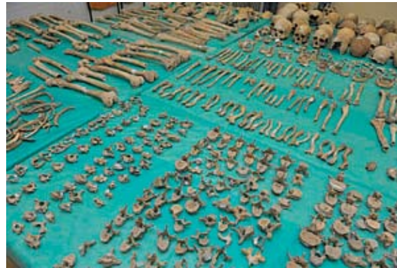
Sl. 2. Koštani ostaci odraslih osoba

Pregledom osteološkog materijala utvrđeno je kako se radi o zajedničkoj grobnoj komori s većim brojem pokojnika (sl. 2). Ukupno su analizirane 903 kosti, od kojih 344 dječjih.