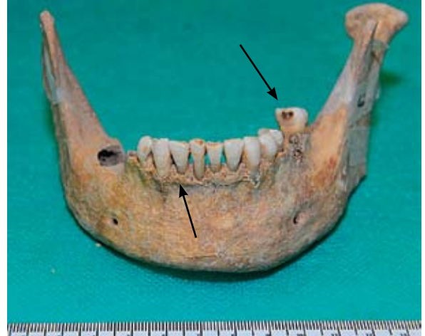
Sl. 7 Zubni karijes i alveolarna resorpcija