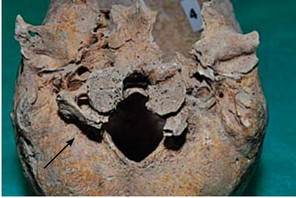
Sl. 5 Atlanto-okcipitalna nesegmentacija