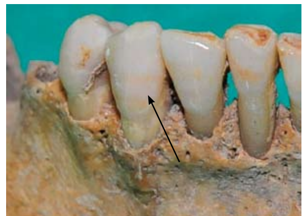
Sl. 9 Hipoplazija zubne cakline

Na dječjim zubima, gornjim i donjim čeljustim nisu pronađene patološke promjene.