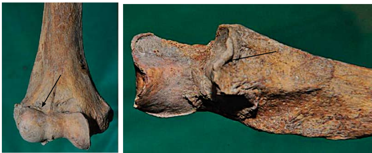
Sl. 10a i b Osteoartritis na lakatnom zglobu