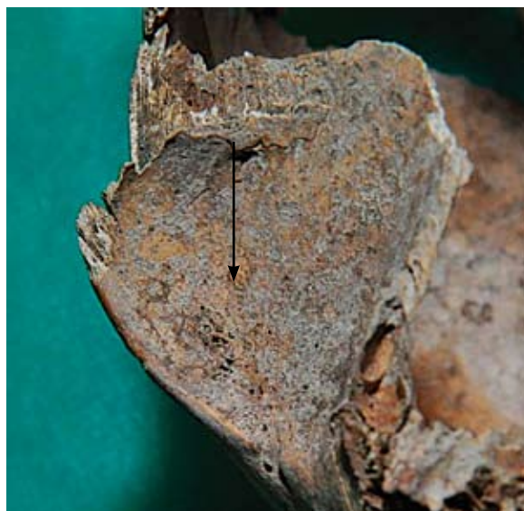
Sl. 3 Cribra orbitalia

Na lubanjama su zamijećene sljedeće patološke promjene: osteoartritis na velikom lubanjskom otvoru, cribra orbitalia (slika 3), devijacija nosnog septuma (slika 4), atlanto-okcipitalna nesegmentacija (slika 5) te upala srednjeg uha ( otitis media ). Također su zamijećene antemortalne (slika 6) i perimortalne traume (tablica 4).