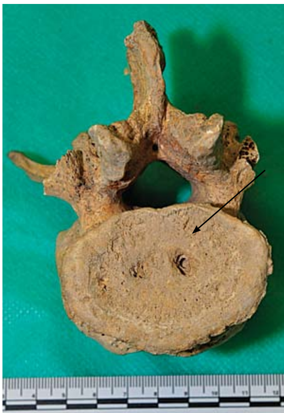
Sl. 12 Schmorlovi defekti na slabinskom kralješku

Schmorlovi defekti zamijećeni su na prsnim i slabinskim kralješcima (slika 12). Na prsnim se kralješcima javljaju isključivo kod starijih odraslih osoba, dok se na slabinskim kralješcima javljaju u znatno nižem postotku kod mlađih odraslih osoba (18,8 %) nego kod starijih odraslih osoba (42,86 %).