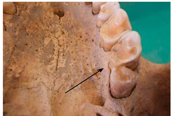
Sl. 8 Znakovi habitualnog trošenja zuba