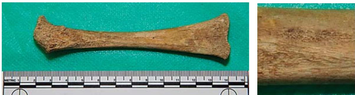
Sl. 11a i b Periostitis na dječjoj bedrenoj kosti, uvećani detalj