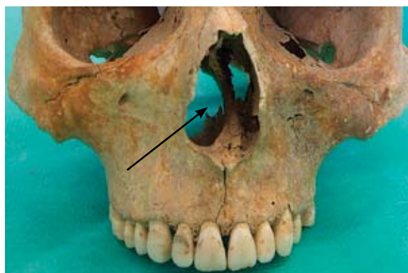
Sl. 4 Devijacija nosnog septuma