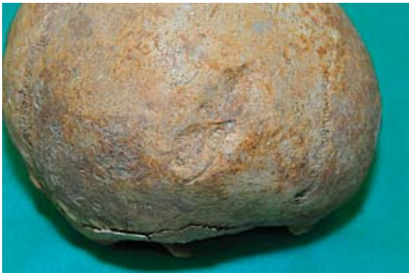
Sl. 6 Antemortalna trauma na lubanji