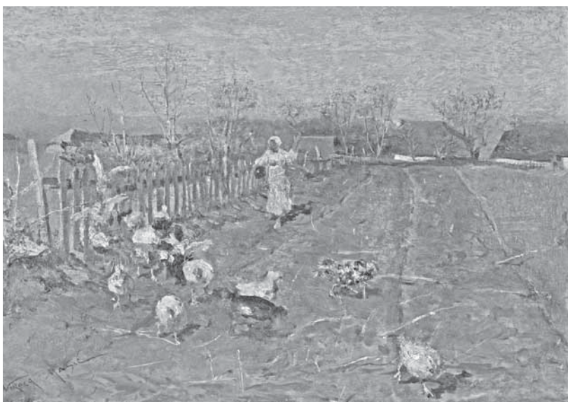
N. Mašić, Kokoši , 1881.

N. Mašić, Goose-Girl by the Sava River, 1880