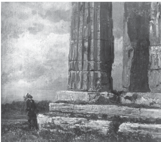
F. Palizzi, Rovine del tempio di Paestum

F. Palizzi, Rovine del tempio di Paestum