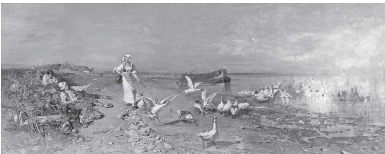
N. Mašić, Guščarica na Savi , 1880.–1881.

N. Mašić, Capri – View of Vesuvius, 1880