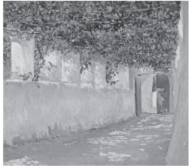
N. Mašić, Pergola II (Capri), 1880. N. Mašić, Pergola II (Capri), 1880