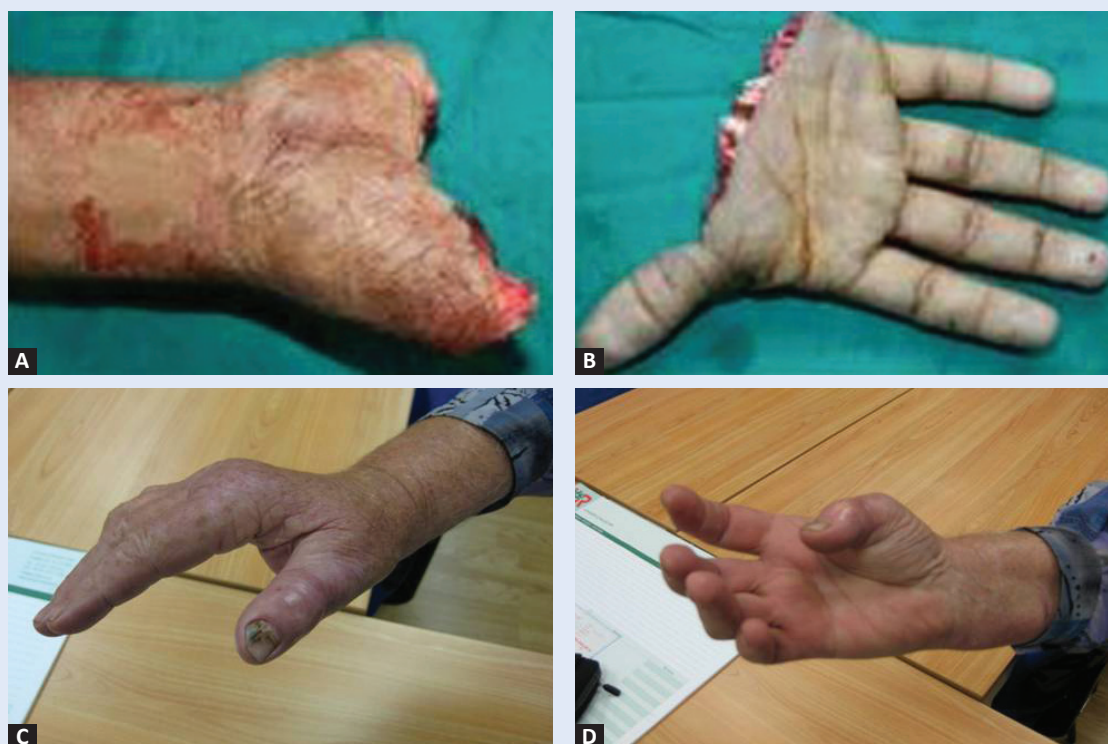
Slika 1. A i B) Traumatska metakarpalna amputacija; C) Funkcijski rezultat nakon replantacije – pronacija; D) Funkcijski rezultat nakon replantacije – supinacija.

Većina "velikih" amputacija također se javlja na radnom mjestu. Veliki industrijski strojevi, indu-