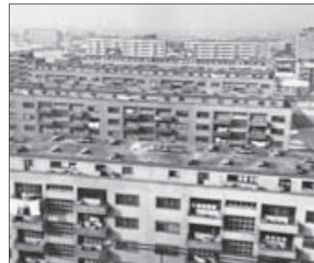
Sl. 4. I. Bartolić, S. Gomboš i V. Hecimović: Višestambene zgrade IV-VIII, južna strana zapadnoga dijela Varaždinske ceste (današnje ulice Grada Vukovara), 1958. U pozadini dvije višestambene zgrade B. Rasice izgrađene 1956.

Tijekom 1946. rad IO-a konstantno su pratile organizacijske i tehničke neprilike. Zbog nedostatka željeza u citavoj državi privremeno je zaustavljena gradnja Varaždinske ceste i građevna se operativna nakratko bavila gradnjom u opeci bez većih tehničkih zahtjeva. 36 Tako su uz gradnju na Volovčici i Željezničarskoj koloniji i prve zgrade u Varaždinskoj, zamisljen kao najreprezentativniji bulevar