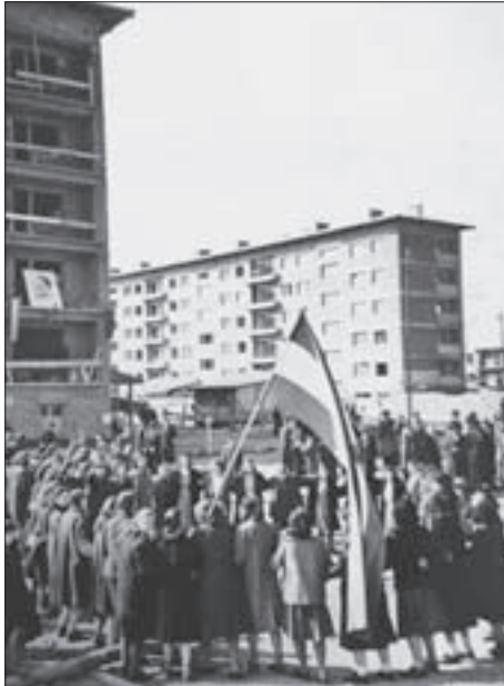
Sl. 5. M. ŽERJAVIC: PET VIŠESTAMBENIH ZGRADA, JUŽNA STRANA ISTOČNOG DIJELA VARAŽDINSKE CESTE (DANAŠNJE ULICE GRADA VUKOVARA), OKO 1950. SVEČANOST POVODOM OTVORENJA DOBROVOLJNIH RADOVA.