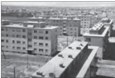
SL. 7. VIŠESTAMBENO NASELJE TVORNICI „RADE KONČAR” U VOLTINOM NASELJU, ZAGREB, 1949. FIG. 7 HOUSING ESTATE OF THE RADE KONČAR FACTORY, VOLTINO ESTATE, ZAGREB, 1949