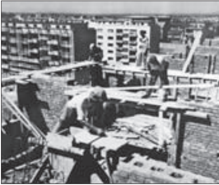
Sl. 3. I. BARTOLIĆ, S. GOMBOŠ I V. HEĆIMOVIĆ: IZGRADNJA VIŠESTAMBENIH ZGRADA IV-VIII, JUŽNA STRANA ZAPADNOG DIJELA VARAŽDINSKE CESTE (DANAŠNJE ULICE GRADA VUKOVARA), TE ZGRADA IX N. ŠEGVIĆA, PRVA ZGRADA IZGRADENA UZDUŽ VARAŽDINSKE CESTE, 1948. U PRVOM PLANU RADNICI NA JEDNOJ OD ZADNJIH ETAŽA ZGRADE IX.