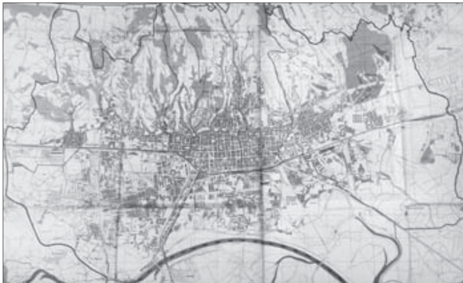
SL. 2. KARTA ZAGREBA IZ 1947. S GRANICOM GRADA I PODJELOM NA ŠEST RAZDJELA (RAJONA) KOJA OTPRILIKE ODGOVARA PRVOJ ŽURNOJ POSLIJERATNOJ RAJONIZACIJI IZ LIPNJA 1945.

Na sjednicama su iznošeni i problemi financiranja po Odjelima u sklopu izvješća za koje