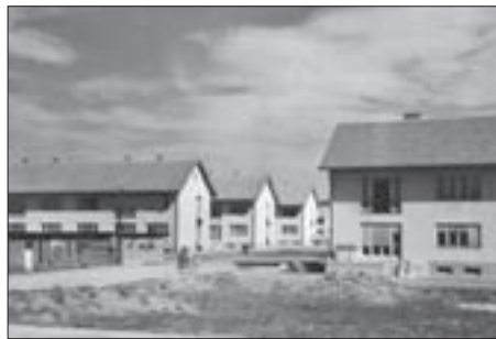
SL. 8. VIŠESTAMBENO NASELJE „ELEKTROPRIVREDE” U MAKSIMIRU, ZAGREB, 1949. FIG. 8 HOUSING ESTATE OF THE ELEKTROPRIVREDA COMPANY IN MAKSIMIR, ZAGREB, 1949