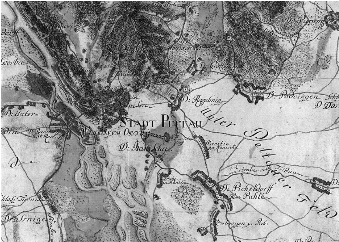
Bild 1 Drau bei Stadt Pettau in 18. Jahrhundert

Infolge der Konstituierung des Königreichs der Serben, Kroaten und Slowenen (1918) bzw. des Abschlusses des Friedensvertrags von Trianon (1920) erlangte die Drau erneut Bedeutung, weil sie als konstitutives Element der Trennung zwischen Staaten und Völkern verwendet worden ist. Diese Funktion verstärkte sich mit dem Ausscheiden Jugoslawiens aus dem sowjetischen Machtblock im Jahre 1948, in dessen Folge die Isolierung Ungarns vom ideologischen »Abweichler« forciert