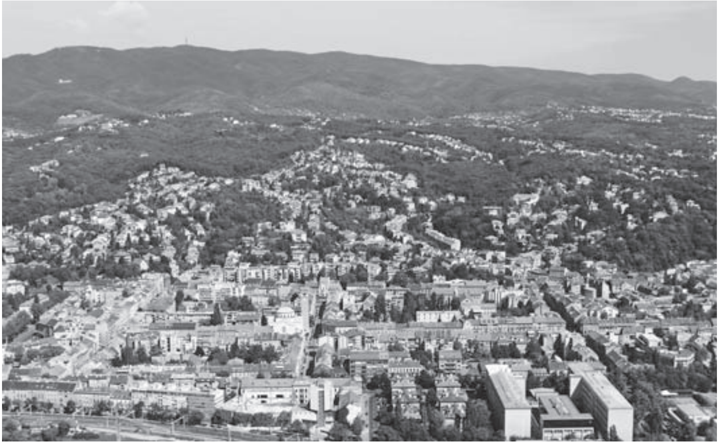
SL. 1. POGLED IZ ZRAKA NA SJEVERNE, BRJEZULJKASTE DIJELOVE GRADA ŽAGREBA, 2005. FIG. 1 AERIAL VIEW ON THE NORTH, HILLY PARTS OF THE CITY OF ZAGREB, 2005