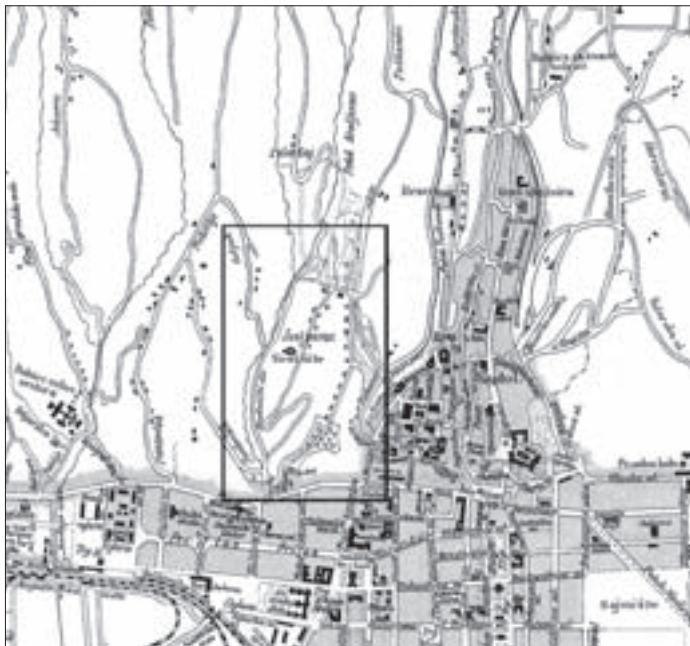
SL. 17. JOSIPOVAC NA NACRTU GRADA ZAGREBA I NOVOPRIPOJENOG TERITORIJA GRADA IZ 1902.

FIG. 17 JOSIPOVAC ON THE MAP OF THE CITY OF ZAGREB AND THE NEWLY ADDED TERRITORY, 1902