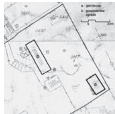
FIG. 16 COTTAGE AT 73 SREBRNJAK STREET, BUILT IN CA. 1921 – FARM BUILDINGS – CONSTITUENT PART OF THE COTTAGE COMPLEX, SECTION OF A CADASTRAL MAP FROM 1967