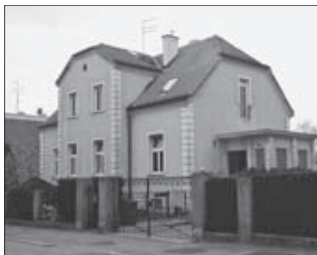
SL. 12. LJETNIKOVAC U ULICI G. KOVAČIĆA 7 FIG. 12 COTTAGE AT 7 G. KOVAČIĆ STREET

FIG. 11 VILLA OLGA COTTAGE – THE COURTYARD AND GARDEN, CADASTRAL MAP FROM 1909-1913