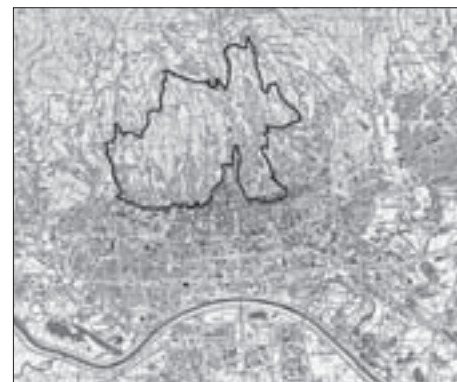
SL. 2. LJETNIKOVAČKI PREDJELI ZAGREBA FIG. 2 COTTAGE AREAS IN ZAGREB

• Propisi za izgradnju zgrada na Josipovcu iz 1888. godine – Ustanove za gradnju sgrada na Josipovcu , odobrene odlukom Visoke kr. hrvatsko-slavonsko-dalmatinske zemaljske vlade (Odjela za unutarnje poslove od 28. svibnja godine 1888. broj 17459), 15 propisuju