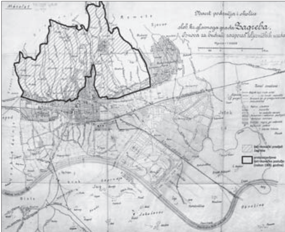
SL. 4. LJETNIKOVAČKO PODRUČJE NA LENUCIJEVU NACRTU PODRUČJA I OKOLICE SLOB. KR. GLAVNOGA GRADA ZAGREBA, OSNOVA ZA BUDUĆI RASPORED ŽELJEZNIČKIH UREDABA IZ 1907.

FIG. 4 COTTAGE AREA IN LENUCI'S PLAN OF THE FREE ROYAL CITY OF ZAGREB AND ITS SURROUNDINGS, BASIS FOR FUTURE RAILWAY REGULATIONS, 1907