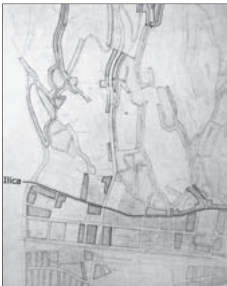
SL. 5. GENERALNI REGULACIONI PLAN ZA GRAD ZAGREB IZ 1937. GODINE (PRILOG/KARTA 4) – PODRUČJE SJEVERNO OD ILICE NA KOJEM JE BILU MOGUĆE PODIZATI I LJETNIKOVCJE FIG. 5 MASTER PLAN FOR THE CITY OF ZAGREB, 1937 (MAP 4) – THE AREA NORTH OF ILICA STREET WHICH WAS ALLOWED FOR THE CONSTRUCTION OF COTTAGES

olaksice za gradnju zgrada poput ladanjskih vila, koje su graditelji zgrada mogli ostvariti samo uz izvođenje propisanih obveza koje se odnose na temelje, visinu zgrade, vatrište, stijene uz dimnjak, vanjsko oblikovanje zgrade, udaljenosti od ograde ceste i susjeda, na kanalizaciju i otpad, gospodarske građevine i njihovu udaljenost od međe te korištenje preostalog zemljišta. Visina zgrade nije smjela biti veća od jednoga kata i nije se smio dograditi polukat. Vanjsko oblikovanje zgrade – „izvanjski lik sgrade” – moralo je biti ukusno izrađeno, da ne nalikuje posve jednostavnoj seoskoj kući, čemu se posebice posvećivala pozornost pri odobravanju projekta. Udaljenost zgrade od ograde duž ceste nije smjela biti manja od četiri metra, tako da se ispred zgrade može izvesti vrt (ulični predvrt), dok udaljenost zgrade od ograde susjeda nije smjela biti manja od deset metara. Ukoliko je zgrada projektirana kao gradska kuća, prema ovom Propisniku mogla se susjedu približiti do pet metara. Izričito je bilo zabranjeno nasloniti zgradu na među.