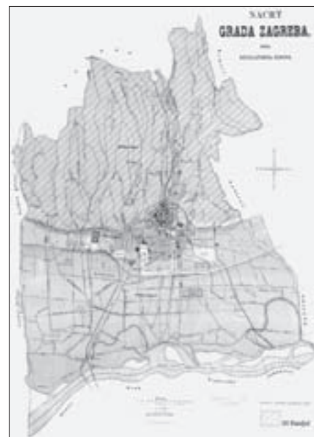
SL. 3. TREĆI RAZDJEL U URBANISTIČKOM PLANU ZAGREBA IZ 1887. GODINE, GDJE JE BILA MOGUĆA IZGRADNJA LJETNIKOVACA (ŠRAFIRANO NA KARTI) FIG. 3 THIRD PARTITION IN THE 1887 ZAGREB'S URBAN PLAN WHERE THE CONSTRUCTION OF COTTAGES WAS ALLOWED (HATCHED AREA)