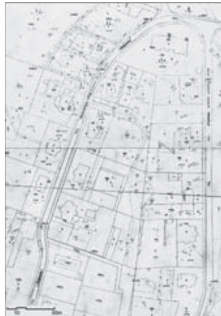
FIG. 18 JOSIPOVAC – SECTION OF THE PRESENT NAZOR STREET AND G. KOVAČIC STREET, CADASTRAL MAP FROM 1909-1913, WITH MARKED CHANGES THAT OCCURRED AFTER 1913

Jurjevsku ulicu od Mlinarske do Cmroka (1907.), Cmrok, Tuškanac (1907.), Pantovčak (1907.), Vinogradsku ulicu sjeverno od Podolja (1907.), Hercegovačku ulicu (1907.) te Vončininu i Vramčevu ulicu (1908.). 25