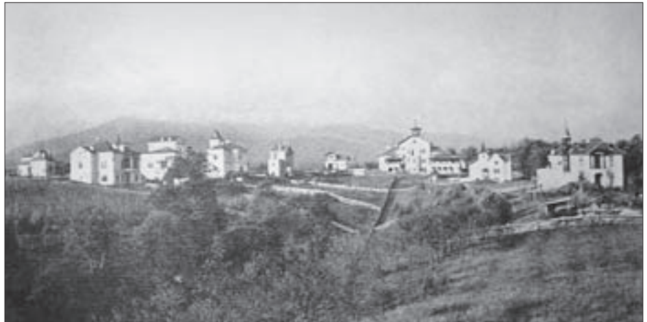
SL. 19. VILE-LJETNIKOVCI NA JOSIPOVCU, POGLED S JUGA, OKO 1890.

Izgradnja ljetnikovačkoga područja Zagreba do Regulatorne osnove iz 1887.-1889. zanemarena je u cjelokupnom planiranju grada. 32 Tek propisi koji dopunjuju Red gradnje iz 1857. godine propisuju način izgradnje po sjevernoj, brježuljkastoj zagrebačkoj okolini. Najznačajniji pomak u regulaciji izgradnje na brježuljcima (poslije – ljetnikovačkom području) donijele su Ustanove za gradnju sgrada na Josipovcu iz 1888. godine , 33 donesene radi regulacije izgradnje naselja na nekadašnjem Josipovcu (danas predio ulica Vladimira Nazora i Ivana Gorana Kovačića). Svojim odredbama prilagođavaju planiranje zadanom terenu, odmiču se od donjogradske blokovske izgradnje i unose urbano u pejsažni prostor grada. 34 Budući da su se sjeverni predjeli smatrali najvrjednijim prostorom za život u gradu Zagrebu, u njima se propisuju parcele većega standarda radi iskorištavanja prednosti prirodne okoliše. Pobornik takvog planiranja ljetnikovačkog/brježuljkastog područja grada bio je Milan Lenuci, koji radi čitav niz regulacija po brježuljcima. Generalni regulacioni plan za grad Zagreb iz 1937. godine još predviđa izgradnju ljetnikovaca, ali je ona sve manjeg intenziteta. Zbog sve većeg broja stanovnika, širenja grada i bolje prometne pove-