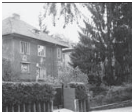
FIG. 9 COTTAGE OF NASTA ROJC – A DETAIL OF THE FENCE