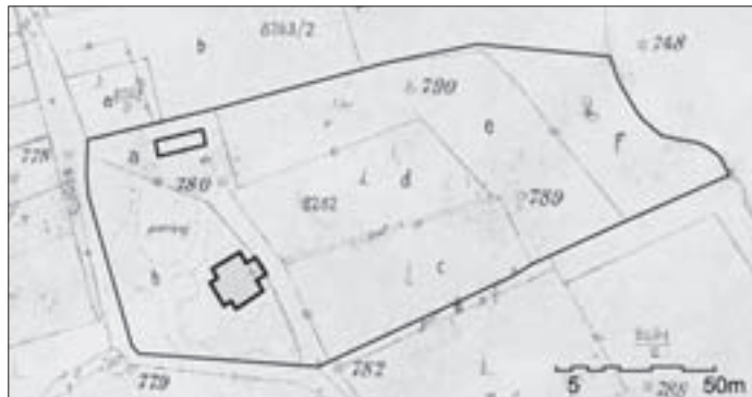
SL. 11. LJETNIKOVAC VILA OLGA – DVORIŠTE I PERIVOJ, KATAstarska KARTA iz 1909.-1913.

FIG. 10 COTTAGE AT 39 PANTOVČAK STREET, CADASTRAL MAP FROM 1909-1913