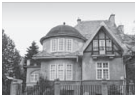
FIG. 14 WUTTE COTTAGE, BUILT IN 1918, CADASTRAL MAP FROM 1963

noga pročelja i cestovnog pravca mogle su se prigraditi stube pod uvjetom da ne sežu više od dva metra od kuće.