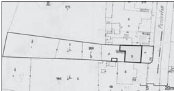
SL. 10. LJETNIKOVAC PANTOVČAK 39, KATAstarska KARTA iz 1909.-1913.

FIG. 10 COTTAGE AT 39 PANTOVČAK STREET, CADASTRAL MAP FROM 1909-1913