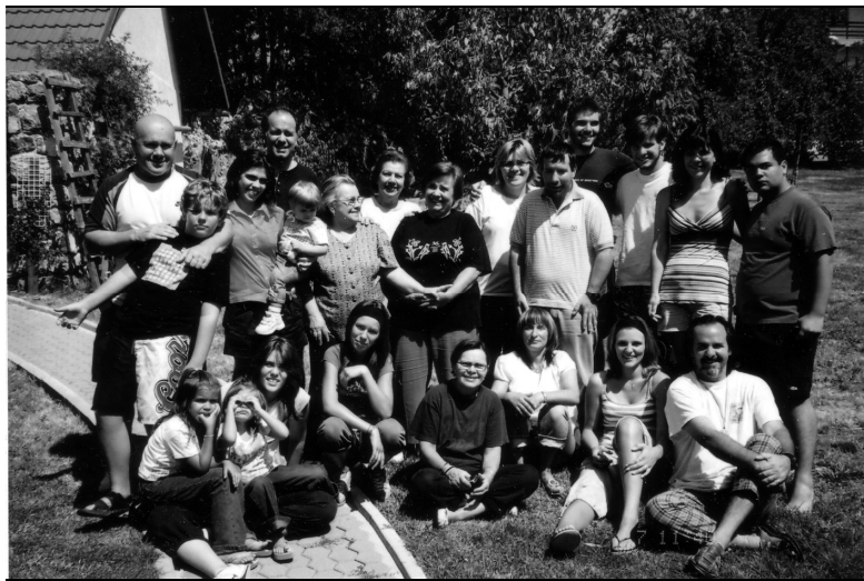
Sl. 2. Članovi obitelj Sekulić i Klepić iz Venezuele i Hrvatske tijekom ljetnih praznika u Lovincu 2009. Vlasništvo Marije Klepić, Seke Čokine , Lovinac.

Pojedinci, koji planiraju povratak u Hrvatsku, odnosno Lovinac, svake godine dolaze u posjet i iz Amerike, kao što su članovi obitelji iz Lovinca koji žive u Venezueli (Sl. 2). Hrvatsku posjećuju svake godine od travnja do rujna, a ovdje su napravili i kuću. Budući da je obitelj velika ne dolaze svi članovi svake godine, nego kako je tko u mogućnosti i sa sobom dovode prijatelje. Kazivačicine sestre dolazi svake godine.