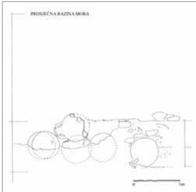
Istočni profil iskopa u sondi 4