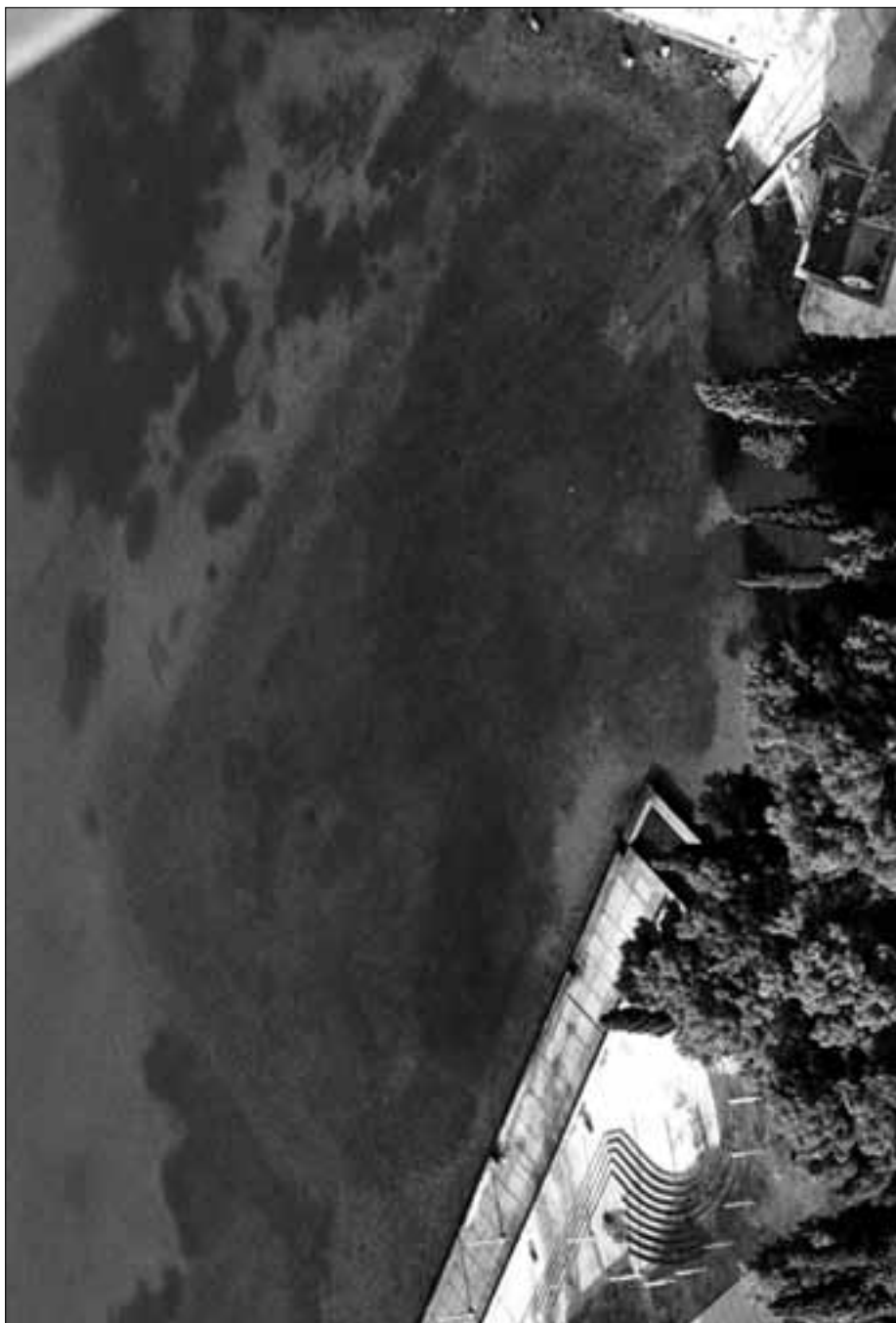
Zračna snimka nalazišta