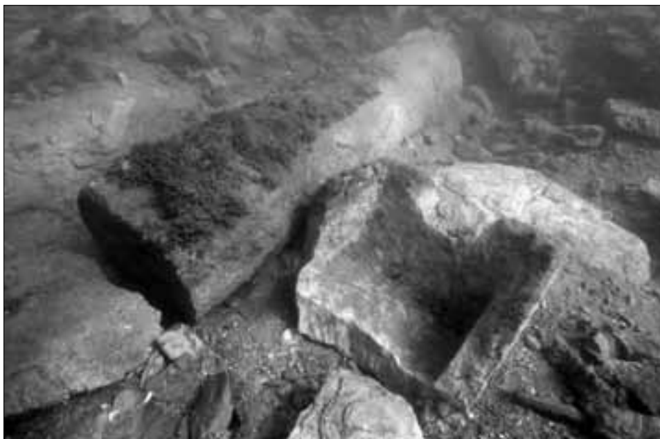
Komad stupa i ulomak četvrtaste urne u sondi 7