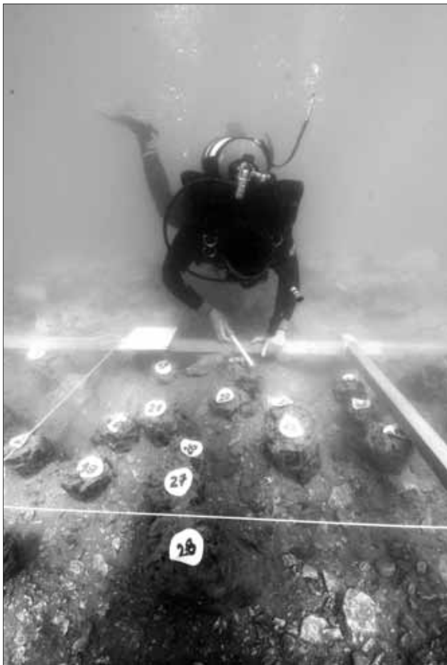
Dokumentiranje drvenih pilona u dijelu sonde 3