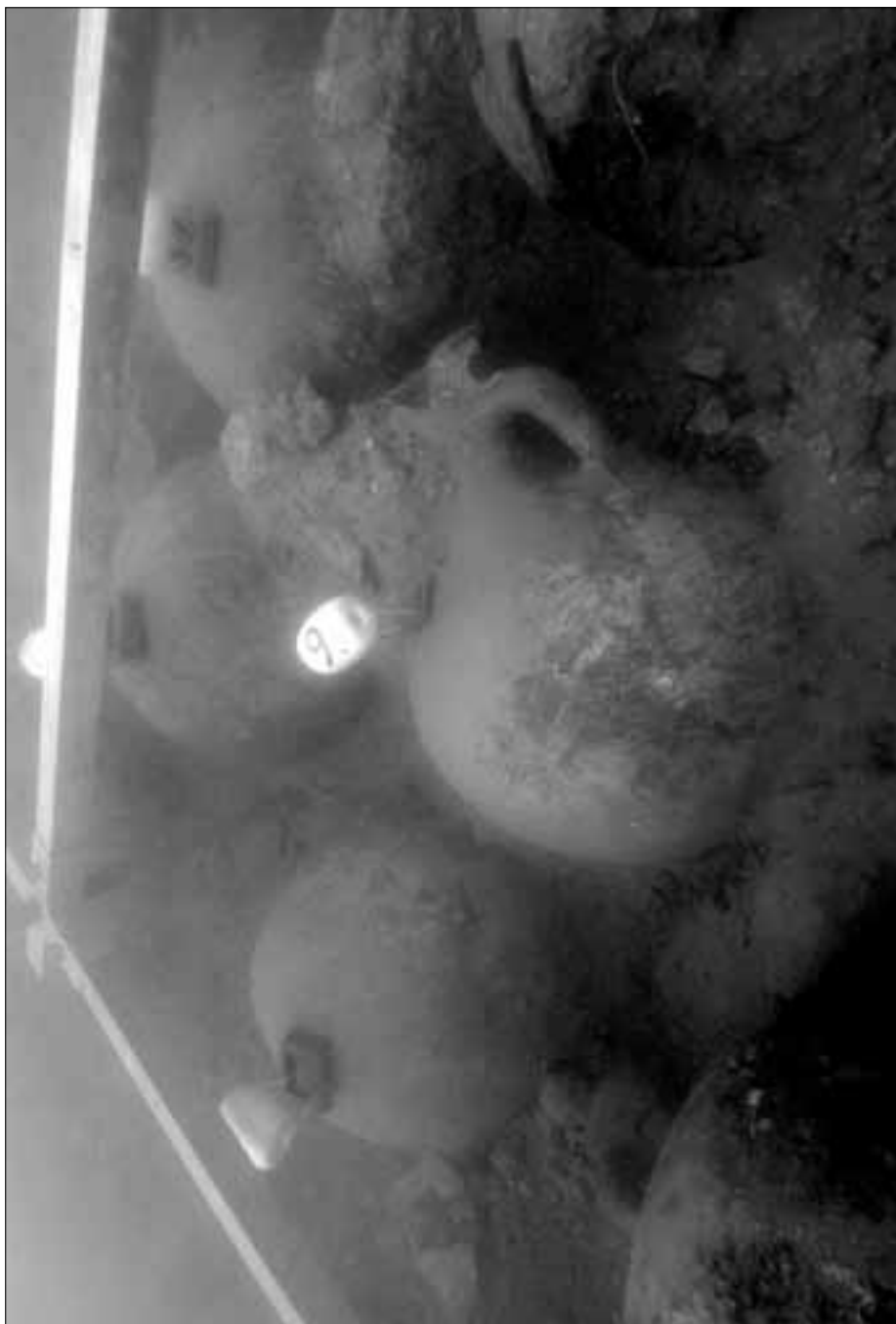
Amfore tipa "Dressel 20" tijekom iskopa u jugozapadnom kutu sonde 4