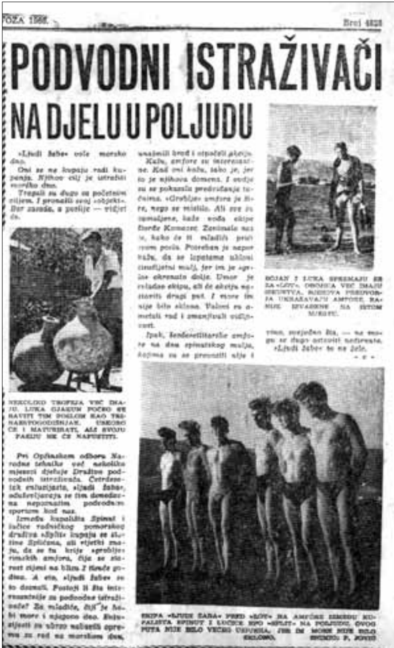
Članak u "Slobodnoj Dalmaciji" o ronilačkom pothvatu u Spinutu 1960. godine