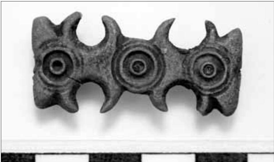
Metalna kopča iz sonde 1