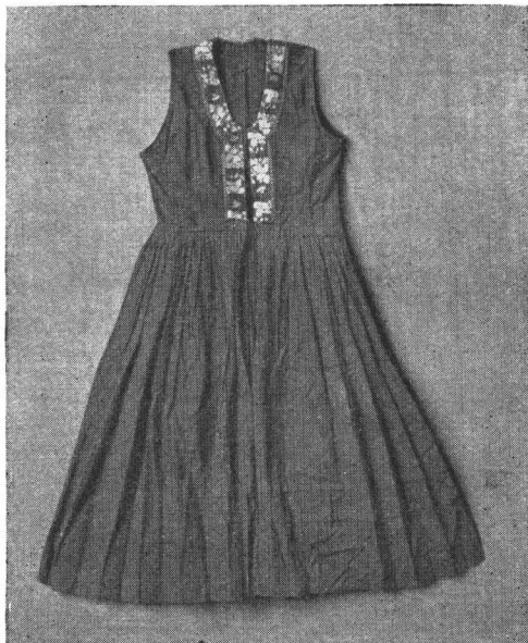
Gornja haljina — »kamažot« — starije ženske nošnje. — Brest. Robe de dessus — »kamažot« — costume féminin ancien de Brest.

Prsten se također mijenjao: u stara su vremena udate žene nosile na prstu prosti prsten od nekoga svijetlog metala, a taj je stajao 5—6 novčića.