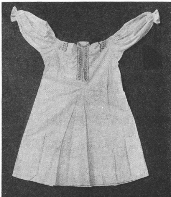
Košulja od bijela platna — ženske starije nošnje. — Brest. Chemise en toile de lin blanc — costume féminin ancien de Brest.

Ova se opisana nošnja izmijenila najprije onda, kada su seljanke počele mjesto stare navedene marame nositi bijele rupce s vezivom, i mjesto suknje kamažot. »Kamažot« je od crnoga platna, od struka na niže je dosta širok i nabran. Što su nabori ljepše stajali i otvarali se kao knjiga, to je seljanka bila ponosnija. Od struka na više »kamažot« je