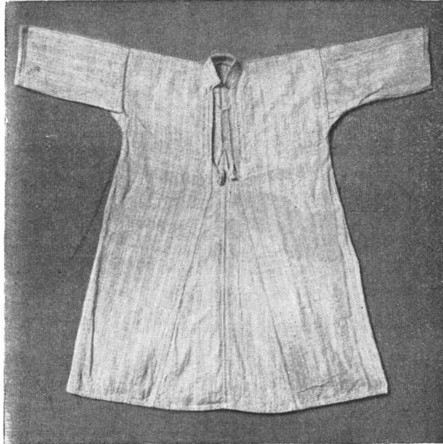
Košulja (starija) od konoplje. — Vele Mune (Istra). Chemise (ancienne) en chauvre de Vele Mune (Istrie).

Zimi su seljanke oblačile preko kamažota gologran (kao kabanicu), koji je posve sličan suknji. Izrađen je od crnoga sukna, bez rukava, a