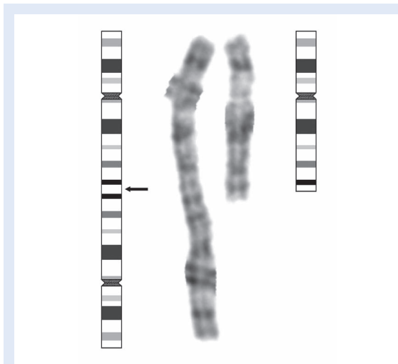
Slika 2. Ideogram X kromosoma i parcijalni kariotip bolesnice s izodicentričnim X kromosomom i normalnim X kromosomom. Crna crta označava točku loma u kromosomskoj regiji Xq28.

Figure 2. Ideogram of the X chromosome and partial karyotype of the patient with isodicentric X chromosome and normal X chromosome. The black bar indicates the breakpoint in the chromosomal region Xq28.