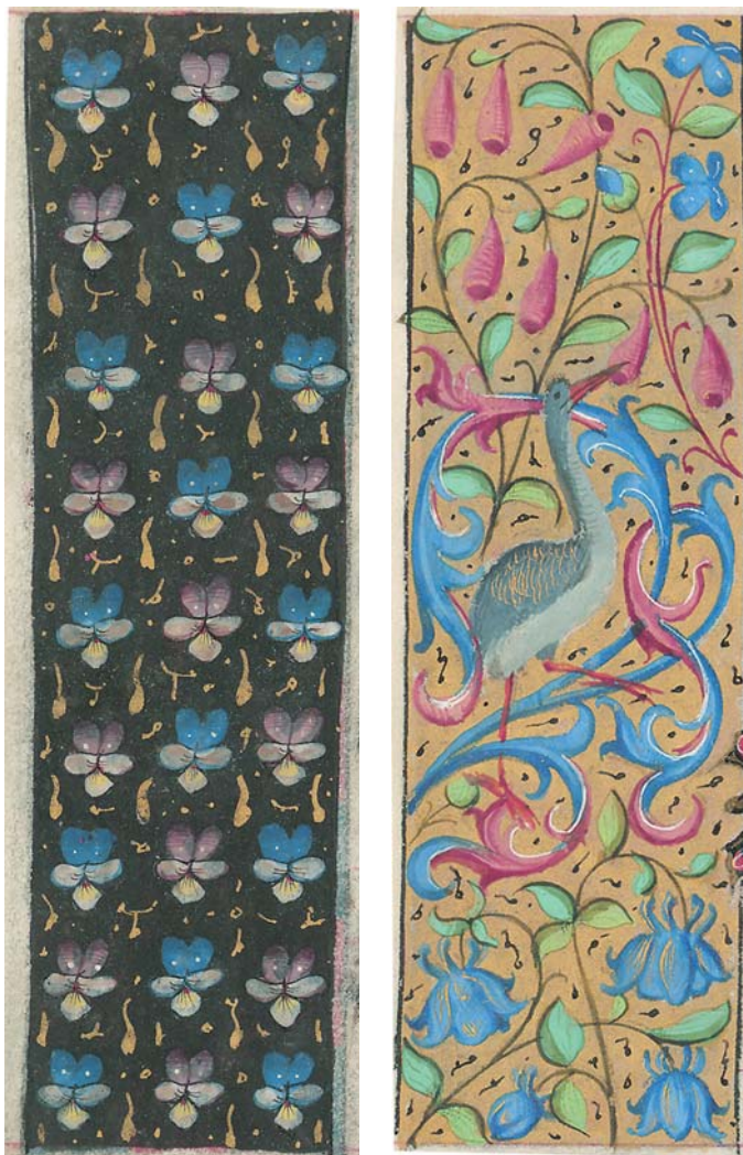
3 »Strukturalno« organizirana bordura sa slobodno raspršenim motivima cvjetnoga tipa s mačuhicama, f. 116v

»Structurally« organized edging with freely scattered floral motifs (pansies), f. 116v