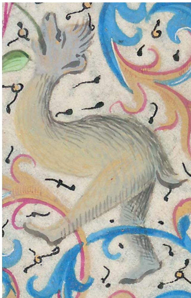
8 Lasica, karanfil i maćuhica, f. 27r Weasel, carnation, and pansy, f. 27r