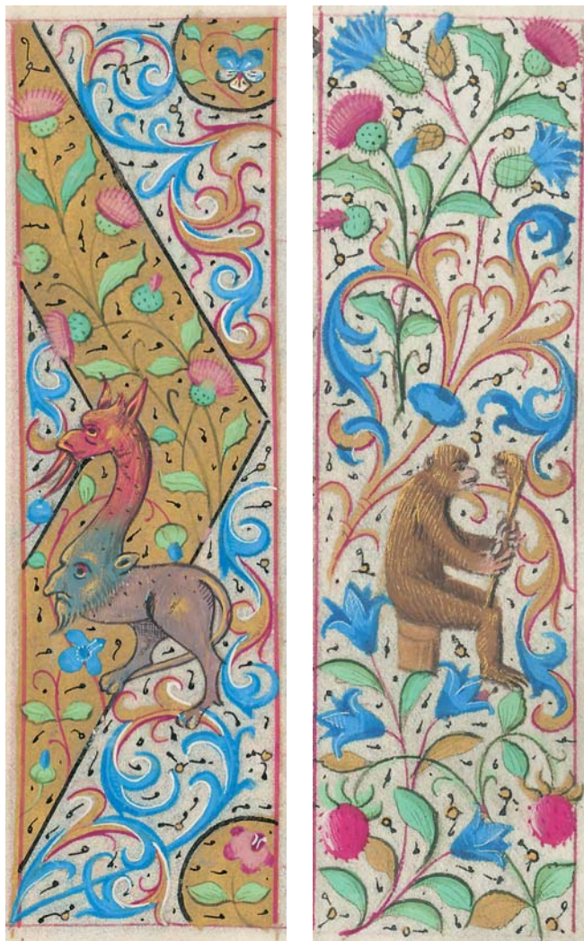
1 Geometrijski tip bordure s akantusom, cvijećem: maćuhica, osjak i čestoslavica, i čudovištem: srednjovjekovni tip grila , f. 154v Geometric type of edging with acanthus leaves, flowers (pansy, thistle, and speedwell), and a monster: a medieval type of gryllus, f. 154v

Dekorativne bordure Strossmayerova časoslova razrađene su s obiljem rješenja, koja upućuju na uhodanu i produktivnu