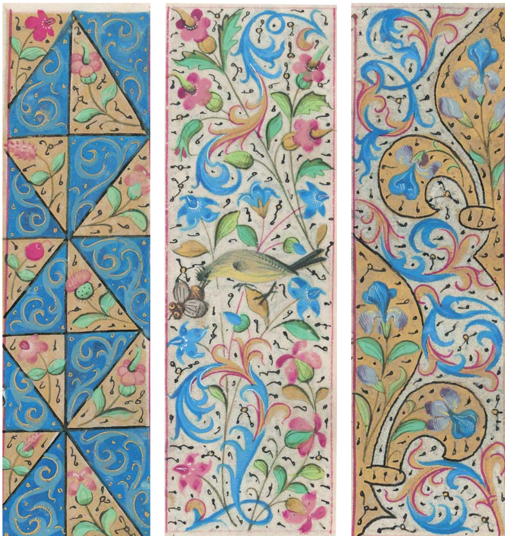
5 Čestoslavica, iglica, poljska djetelina, sivkasta ljubičina, plod, osjak, f. 58r Speedwell, geranium, field clover, matthiola, fruit, and thistle, f. 58r