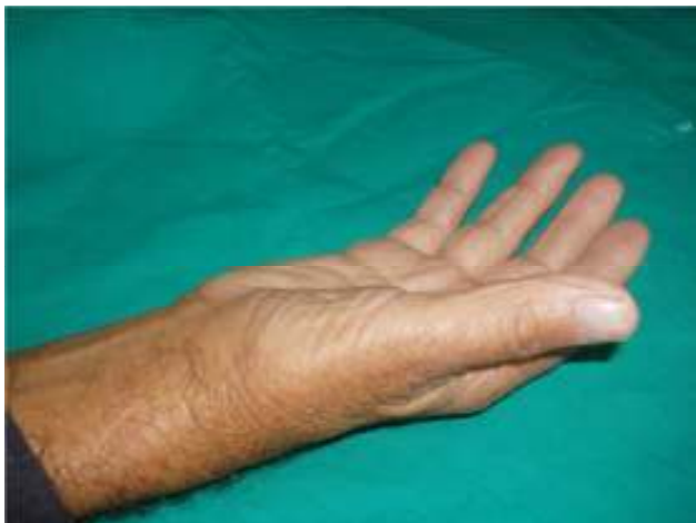
Slika 1. Atrofija mišića tenara Picture 1. Thenar muscle atrophy