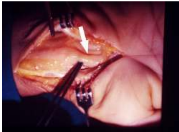
Slika 2. Na mjestu kompresije n. medianus je ljevkasto sužen Picture 2. Median nerve funnel-shaped narrowing at the site of compression

je učinjen u općoj endotrahealnoj anesteziji u bližoj stazi. Tipičnim rezom kože prikazao sam transversalni ligament (ligg carpi transversum-retinaculum flexorum) koji sam uzdužno presjekao i našao makroskopski vidljivu kompresiju n. medianusa u obliku ljevkastog suženja na mjestu prolaska ispod transversalnog ligamenta. (Slika 2). Intraoperativno sam uzeo dio fleksornog retinakula, te poslao na patohistološki pregled. Bojanjem preparata Congo crvenilom, koje je specifično za dokazivanje amiloida, (Slika 3), vide se nakupine amiloida, a na histološkom preparatu promatranim polarizacijskim mikroskopom (Slika 4) vide se karakteristične nakupine amiloida boje poput zelene jabuke. Od kako je krenuo na hemodijalizu do operativnog zahvata bolesnik je bio podvrgnut hemodijalizi tijekom 190 mjeseci, od čega je 153 mjeseca (82,3%) obavljao hemodijalizu „low flux“ dijalizatorom, a „high-flux“ dijalizatorom 33 mjeseca (17,7%). U vrijeme kada je učinjen operativni zahvat hemodijalizu je provodio „high-flux“ dijalizatorom. Nakon operativnog zahvata bolesnik je proveo fizikalnu terapiju i postoperativno više nije imao tegobe.