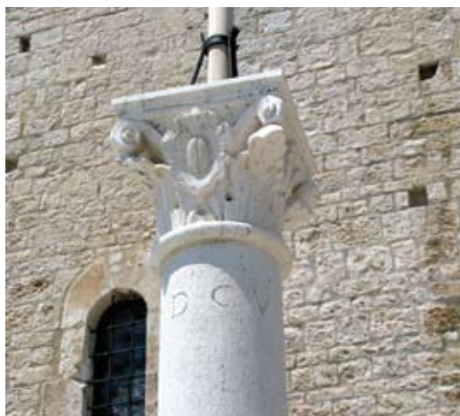
Kapitel šandarca zastave u trogirskoj luci

U dvorištu Lucićeve palače stupovlje atrija, trifora s kapitelima all' antica , piramidalne konzole pod vijencem, balustrada, te brojni drugi građevni djelovi ukazuju na djelovanje Bokanićeve radionice. Njoj se može pripisati i kruna bunara s Lucićevim grbom te karakterističnim licem ovjenčanim zrakama, standardnim dekorativnim elementom radionice.