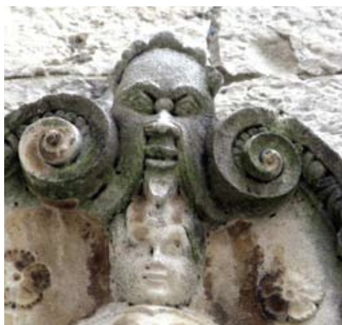
Grb gradskog kneza Dominika Contarinija, detalj

često koristi kao dekorativni element. Nalazimo ga tako na vijencu zvonika trogirске katedrale, na kaminu kuće Kvarko i brojnim drugim primjerima. Ispod Contarinijeva grba je nadvratnik nekadašnjeg ulaza u vijećnicu s natpisom: