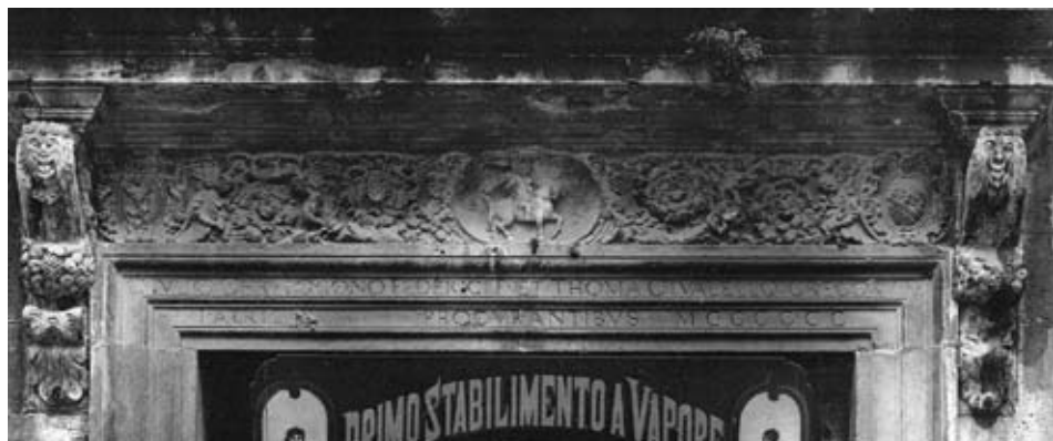
Crkva sv. Šimuna u Zadru, nadvoj ulaznih vrata i prozor na pročelju crkve