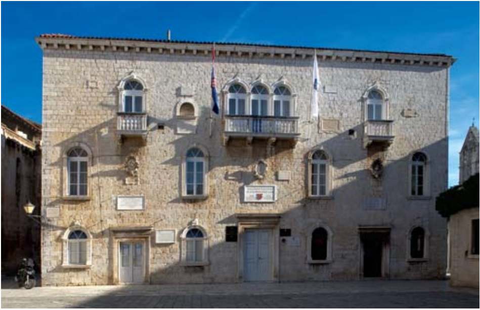
Trogir, komunalna palača, zapadno pročelje

krilati anđelčići u pokretu, poigravajući se volutama njegova raskošna okvira. Donji dio grba završava girlandama lovora i voća ovješeno s obje strane grotesknog maskerona. Izvrstan klesarski i kiparski rad djelo je vrsnog klesara i kipara, a ornamenti karakteristični za Bokanićev repertoar upućuju na Trifuna kojemu bi to bio jedan od zrelih radova. Spomen na zahvat ispisan na mramornoj ploči datiran je 1608. godinom: