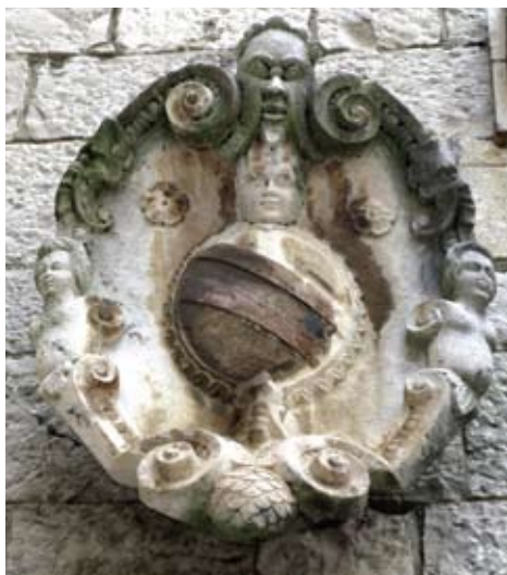
Grb gradskog kneza Dominika Contarinija iz 1609. u atriju trogirске komunalne palače