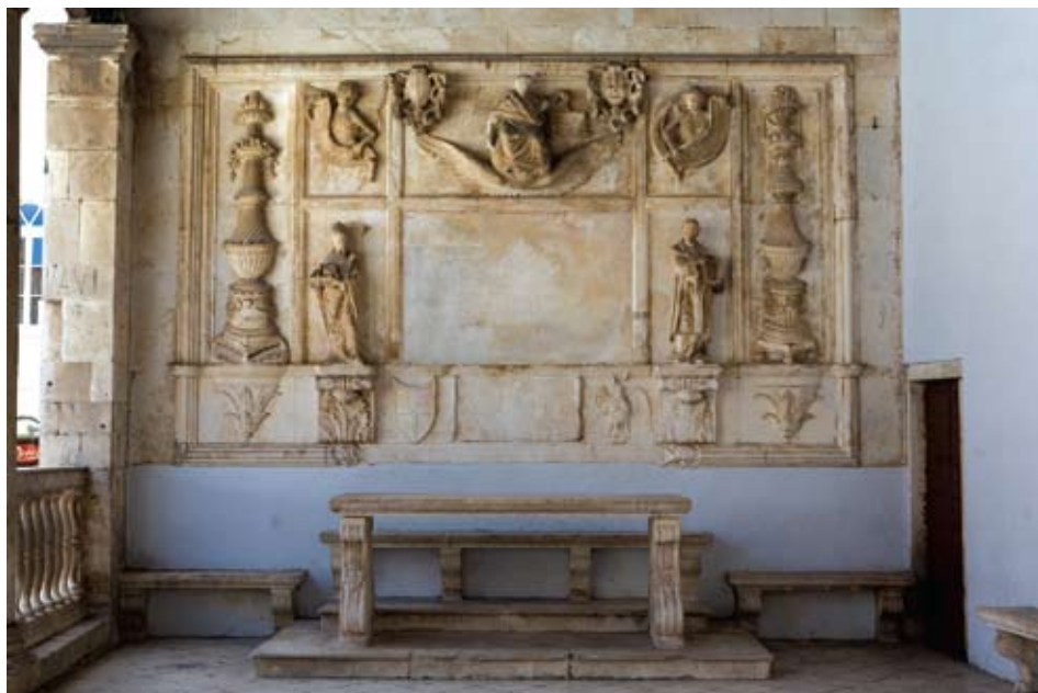
Gradska loža u Trogiru, retabl Pravde Nikole Firentinca s grbovima grada i gradskog kneza, rad Trifuna Bokanića

Za istog kneza, godinu dana poslije, 1606. godine, Trifun Bokanić je obnovio trogirsku gradsku ložu. 22 Njegova su djela klupe uz istočni i južni njezin zid i kameni sudački stol, ukrašen grbovima kneza Ambroza Cornara i grada Trogira, isklesanim na volutama njegovih masivnih kamenih nogu te raskošno ukrašeni kameni grbovi obješeni uz Firentinčev reljef Justicije. Spomen na obnovu zabilježen je natpisom pod retablom Pravde na istočnom zidu lože. Natpis je uklesan na vrpci koja je razapeta između dviju tipičnih bokanićevskih lavljih glavica.