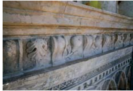
Trifun Bokanić, metope vijenca zvonika trogirске katedrale s muškom glavom i floralni motivima