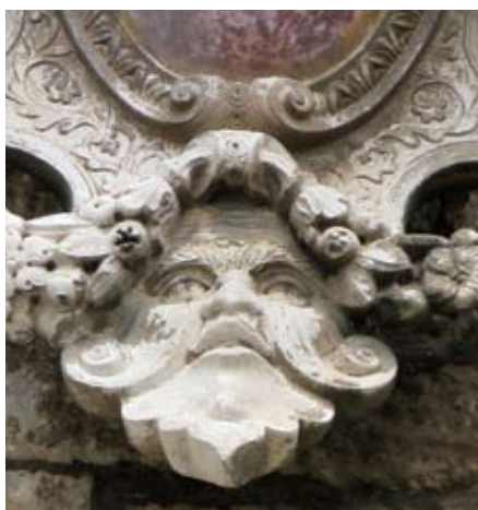
Grb gradskog kneza Morosinija, detalj