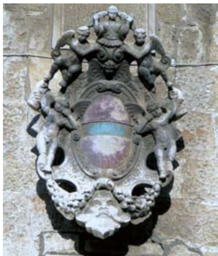
Komunalna palača u Trogiru, grb kneza Morosinija