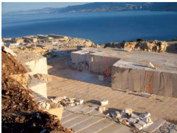
Sl. 1. Primjer ležišta prirodnog kamena s oznakama položaja bušotina

Posebna se pozornost stoga mora posvetiti istraživanju ležišta arhitektonsko-građevnog kamena. Istraživanje omogućuje utvrđivanje geološke građe i sastava ležišta. Ponajviše se to odnosi na određivanje strukturno-petrografskih značajki ležišta i tehničko-tehnoloških značajki kamena. Istraživanjem se prije svega trebaju zadovoljiti potrebe za određivanjem dekorativnosti kamena, posebice ako se radi o novom varijetetu