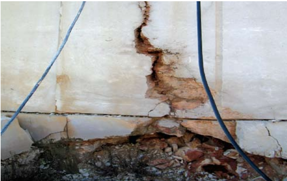
Sl. 5. Kavernozna zona

U prikazu presjeka bušotine svaki se prekid jezgre mora označiti na način iz kojega je vidljivo je li prekid uzduž prirodnog diskontinuiteta ili je nastao kao rezultat nepravilnog rada.