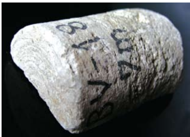
Sl. 2. Kamena jezgra izbrušena u osnovici zbog nepravilnog bušenja (porozni vinicit)

Na osnovi dugogodišnjeg iskustva može se sa sigurnošću tvrditi da se kvalitetom istražnog bušenja i interpretacijom dobivenih rezultata može učiniti znatan napredak