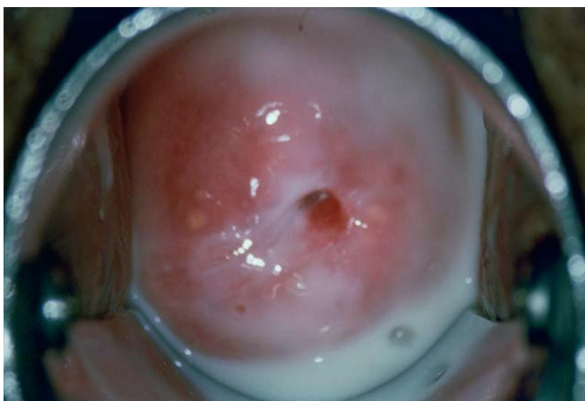
Slika 1. Pojačani vodenasti mliječno-sivkasti iscjedak u dnu rodnice Figure 1. Profuse watery greyish white discharge at the bottom of the vagina