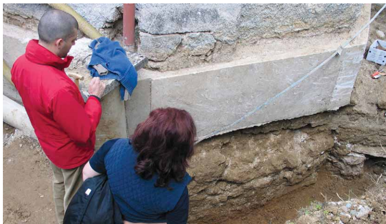
Slika 3 – pogled na temelje i betonsku oblogu u sondi 2b.

U sondi 2b vrlo je primjetna nekvalitetna izvedba betonskog ojačanja temelja i loša izvedba drenaže, koja je više naštetila zidovima crkve nego zub vremena (Slika 3). Temelji su dubine 140 cm ispod betonske obloge. Rađeni su od tuha i sivca uz obilato korištenje veziva. U ovoj je sondi bilo grobnih ukopa, ali vrlo oštećenih i parcijalnih, pa su identificirana samo četiri (grobovi 12, 16, 21, 22), i to tek ispod dubine od 150 cm. Ostali su prepoznati po nalazima medaljica, krunica i prstena.