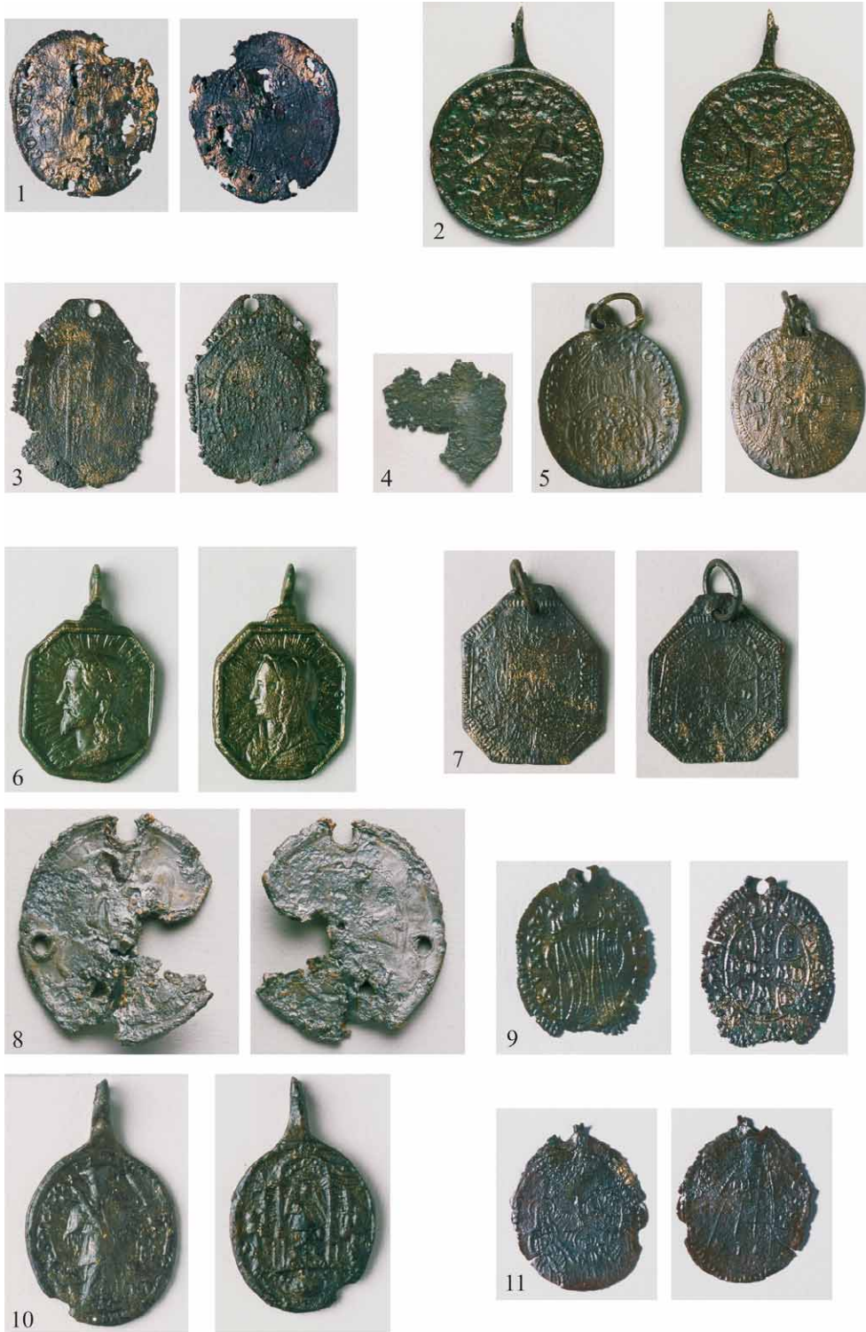
Tabla 1 – Plate 1