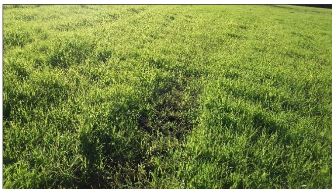
Tunge gjødselvogner reduserer grasveksten og øker faren for jordpakking, spesielt i år med mye nedbør.