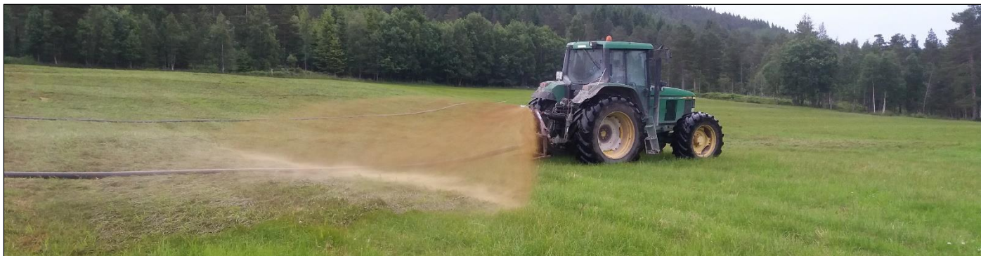
Bruk av slepeslanger gir minimalt med jordpakking og er en miljømessig god måte å spre husdyrgjødsel på.

I tillegg kommer alle fordelene man oppnår for avling, økonomi, klima og miljø ved å unngå kjøring på dyrkamark med tung gjødselvogn.