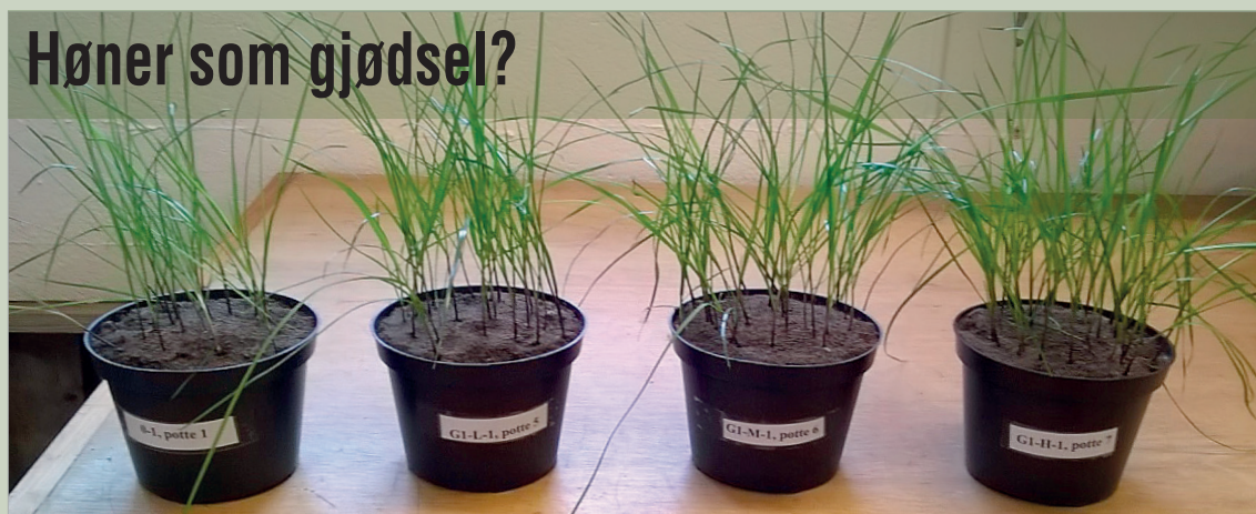
Figur 1. Potter med raigras klar for første høsting, 31. mars 2017. Fra venstre: Kontroll uten gjødsel, deretter pottes gjødslet med lav, middels og høy mengde sediment, også kalt grakse, av slaktet, finmalt og hydrolysert høne. Avlinga per potte var i snitt 1,5 g for kontroll-leddet, 2,9 g for lav, 3,9 g for middels og 3,9 g for høy mengde sediment (snitt for 3 gjentak).