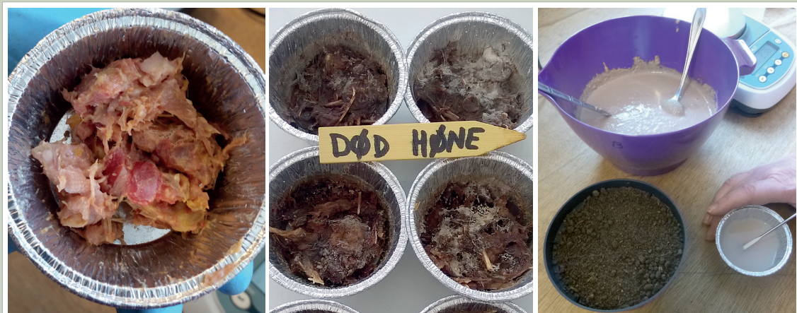
Fra venstre: Ferskt materiale av hele høner etter avlaving og hakking. I midten: Samme materiale etter 4 måneders lagring ved 10-15 °C. Til høyre: Bollen inneholder sediment etter hydrolyse av slaktede, finmalte høner. Sedimentet ga god vekst til raigras i et pottforsøk, se figur 1.

jorda. Det var imidlertid ikke tilfelle. Det var derimot en svak økning i P-AL med økende gjødsling og dermed med økt plantevekst. Dette er vanskelig å forklare, men kan være et utslag av tilfeldig variasjon. Tilsynelatende betydelige økninger i P-AL ved tilførsel av middels og høy mengde kalksalpeter i pletter uten planter er vanskelig å forklare, men det kan være en mulighet at tilførsel av nitrogen har stimulert nedbrytning av organisk materiale i disse pottene, slik at jorda er blitt anrikt på P ved at organisk materiale er dampet bort.