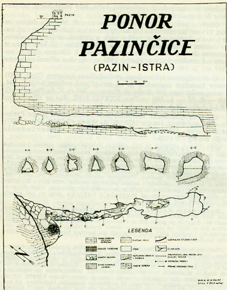
Sl. 1. Tlocrt, uzdužni i poprečni profili ponora Pazinčice