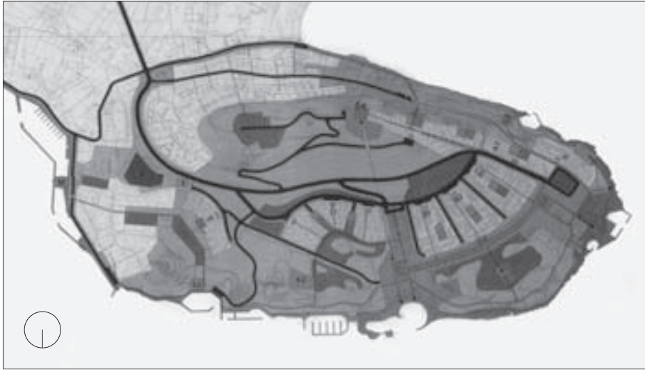
SL. 5. PLAN NAMJENE POVRŠINA; URBANISTIČKI PROJEKT BABIN KUK – DUBROVNIK IZ 1969. G. (PLAN IZRADIO: URBANISTIČKI INSTITUT SR HRVATSKE, ZAGREB, UZ SURADNJU INSTITUTA ZA EKONOMIKU TURIZMA IZ ZAGREBA, SWECO-CONSULTING ENGINEERS, ARCHITECTS AND ECONOMISTS, ŠVEDSKA, I SURADNIKA IZ KOPENHAGENA, DANSKA)

FIG. 5 LAND ALLOCATION PLAN; URBAN PLANNING PROJECT BABIN KUK – DUBROVNIK, 1969 (PLAN MADE BY URBAN PLANNING INSTITUTE, SR CROATIA, ZAGREB, IN COLLABORATION WITH THE TOURISM ECONOMICS INSTITUTE, ZAGREB, SWECO CONSULTING ENGINEERS, ARCHITECTS AND ECONOMISTS, SWEDEN AND ASSOCIATES FROM COPENHAGEN, DENMARK)