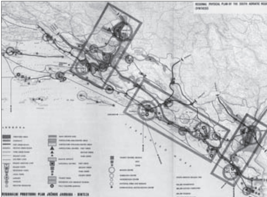
SL. 3. REGIONALNI PROSTORNI PLAN JUŽNOG JADRANA – SINTEZA IZ 1969. G.

FIG. 3 REGIONAL SPATIAL PLAN OF THE SOUTH ADRIATIC – SYNTHESIS FROM 1969