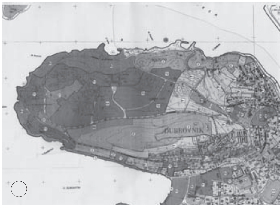
SL. 7. NAMJENA POVRŠINA; IZVOD IZ GENERALNOGA URBANISTIČKOG PLANA GRADA DUBROVNIKA IZ 2008. G. (PLAN IZRADIO: URBOS D.O.O., SPLIT) FIG. 7 LAND ALLOCATION; GENERAL URBAN PLAN OF DUBROVNIK, 2008 (PLAN MADE BY URBOS LTD, SPLIT)

početkom 70-ih godina zaključeno kako je potrebna hitna urbanistička intervencija u smislu programiranja i prostornog usklađenja pojedinačnih interesa Solarisa s jedinstvenim interesom razvoja grada Šibenika. Temeljem nacrtu Generalnoga urbanističkog plana grada Šibenika, na području Zablaca predviđena je izgradnja novoga grada Šibenika II, i to tako da se stambena i turistička namjena međusobno isprepleću. Turističko područje Solaris trebalo je aktivirati prostor Zablaca 48 na način da postane veza između ta dva Šibenika – staroga i novoga.