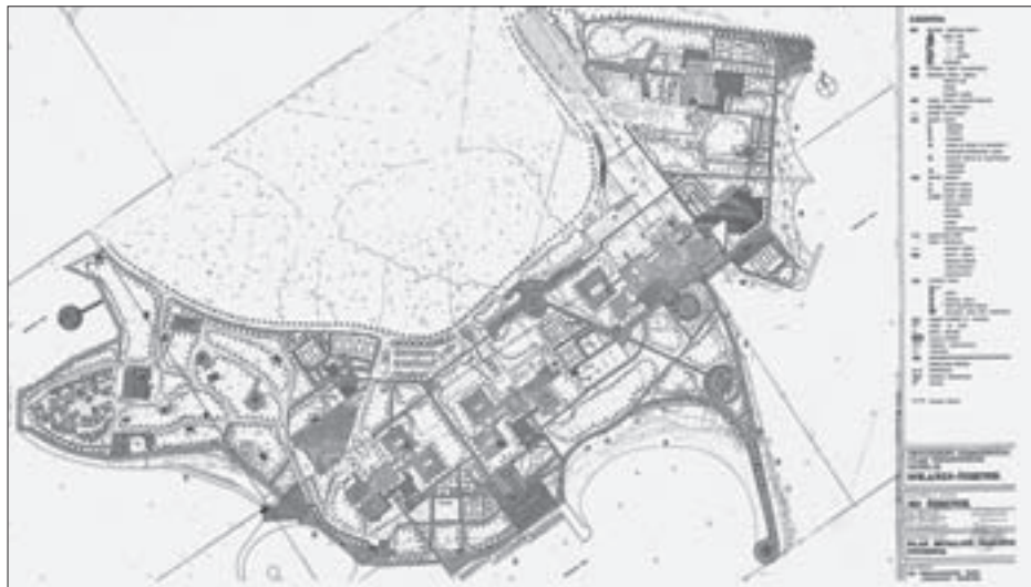
SL. 6. NAMJENA POVRŠINA; PROVEDBENI URBANISTIČKI PLAN TURISTIČKOG NASELJA SOLARIS, ŠIBENIK IZ 1989. G. (PLAN IZRADIO: URBANISTIČKI BIRO PROSTOR, ŠIBENIK) FIG. 6 LAND ALLOCATION; DETAILED URBAN PLAN OF THE SOLARIS TOURIST SETTLEMENT, ŠIBENIK, 1989 (PLAN MADE BY THE URBAN PLANNING BUREAU PROSTOR, ŠIBENIK)

Turističko područje Solaris smješteno je u jugoistočnom dijelu šibenske mikroregije, na području poluotoka Zablaca koji ima ukupnu površinu od 200-tinjak ha, sa sjevera određeno depresijom Velike Soline, sa zapada zaravnom Zablaca te s istoka Podsolarskim zaljevom. Dominantan reljef 60-ih godina prošlog stoljeća koji je karakterizirao prostor Zablaca bili su vapnenački grebeni, udoline i zaravni, dok je obala bila niska, pitoma s prirodnom vegetacijskim pokrivačem 44 koji je mjestimično sezao do samog mora. Za razliku od turističkog područja Babina Kuka kojega je prostorni obuhvat bio određen prostornim