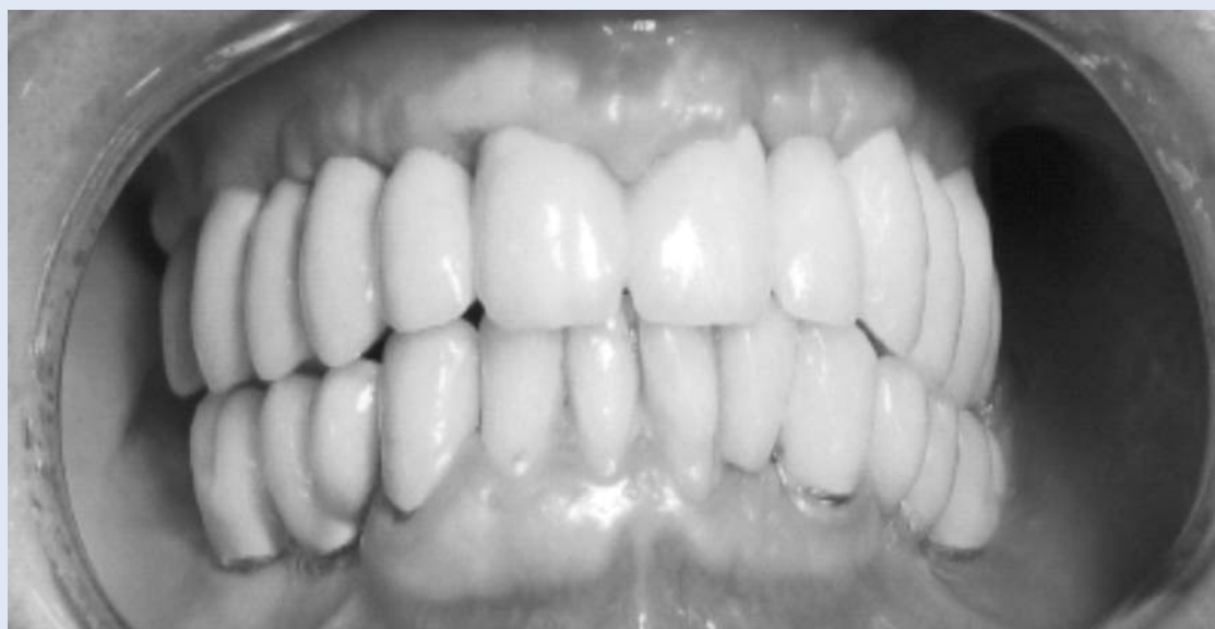
Slika 3. Protetski nadomjestak nakon definitivnog cementiranja

Figure 3. Clinical appearance immediately after cementing fixed bridge