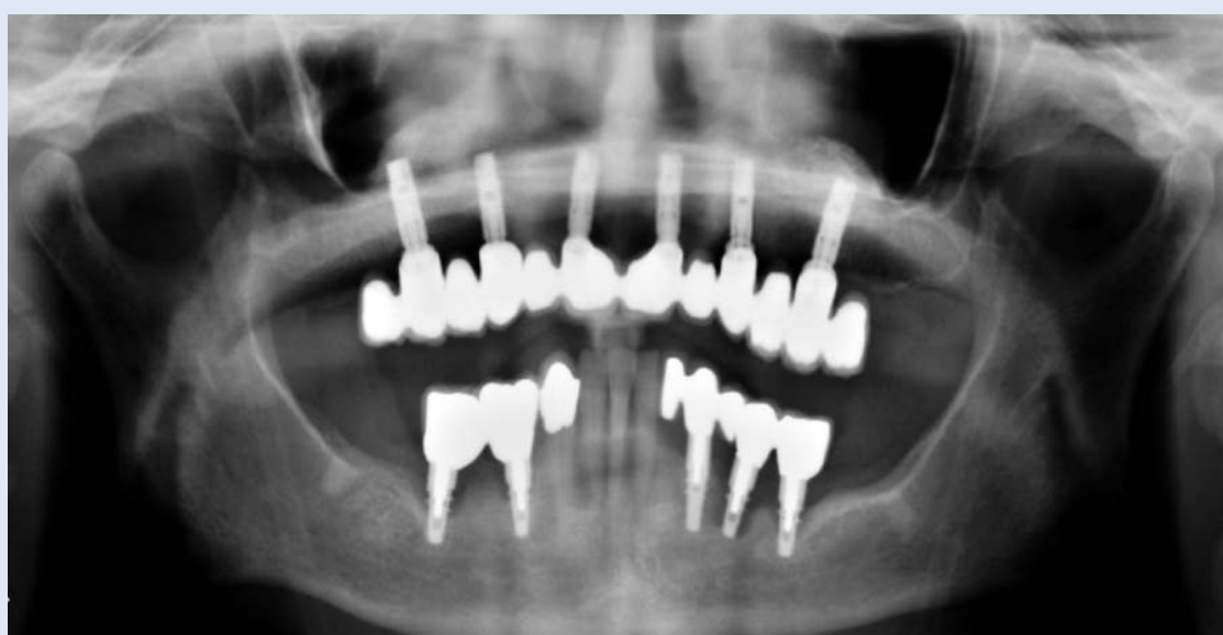
Slika 4. Ortopantomogram godinu dana nakon završetka rada

Figure 3. Clinical appearance immediately after cementing fixed bridge