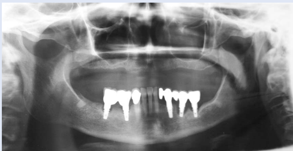
Slika 1. Prijeoperativna ortopantomogram snimka

Bolesnici su obrazloženi svi aspekti planirane terapije kao i moguće komplikacije. Bolesnica se složila s navedenim prijedlogom terapije te potpisala suglasnost za navedeni zahvat.