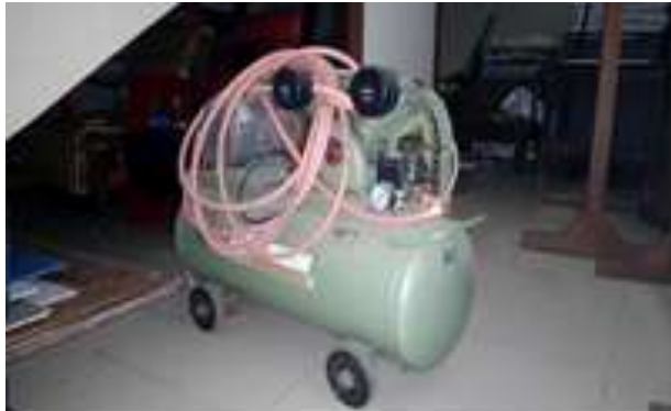
Gambar 10. Introduksi mesin teknologi tepat guna meningkatkan produktifitas