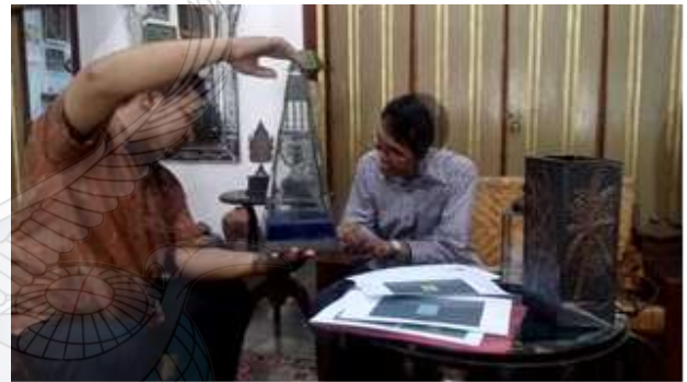
Gambar 13. Diskusi pengembangan desain