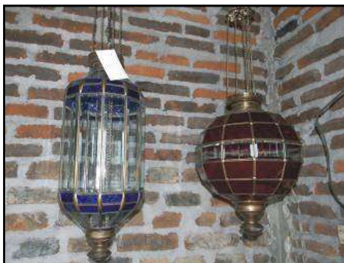
Gambar 02. Lampu hias kaca produksi pengrajin lampu hias kaca “Fajar Glass” yang dihasilkan dari bahan limbah kaca

Sektor pariwisata merupakan salah satu sektor unggulan disamping industri dan pertanian yang diusung oleh Pemkab Karanganyar. Berkah dari keindahan alam merupakan potensi besar untuk dikembangkan baik obyek wisata secara fisik maupun sarana prasarana pendukungnya. Pengembangan UMKM di sektor ini diharapkan dapat ikut berkontribusi dalam memajukan kepariwisataan di Kab Karanganyar, hingga pada akhirnya nanti dapat berperan dalam ikut mengangkat kesejahteraan masyarakat khususnya pelaku usaha di sektor penunjang pariwisata tersebut.