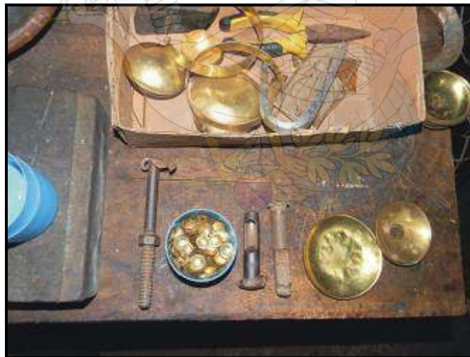
Gambar 06. Alat bantu produksi yang masih sederhana, berupa betel pemotong dan betel pembuat knop yang dibuat sendiri dari bahan yang sederhana

Hasil identifikasi di lapangan menunjukkan bahwa kebutuhan pengrajin lampu hias kaca “Fajar Glass” adalah di bidang desain, teknologi produksi yang diharapkan mampu meningkatkan efisiensinya dari rata-rata hasil produksi 78 pcs perbulan menjadi rata-rata hasil produksi 120 pcs (peningkatan sekitar 30 %) serta media promosi berupa pengadaan catalog produk/ brosur yang menarik dan memudahkan calon konsumen untuk melihat produk desain lampu hias kaca keluaran “Fajar Glass”. Sedangkan kebutuhan pengrajin