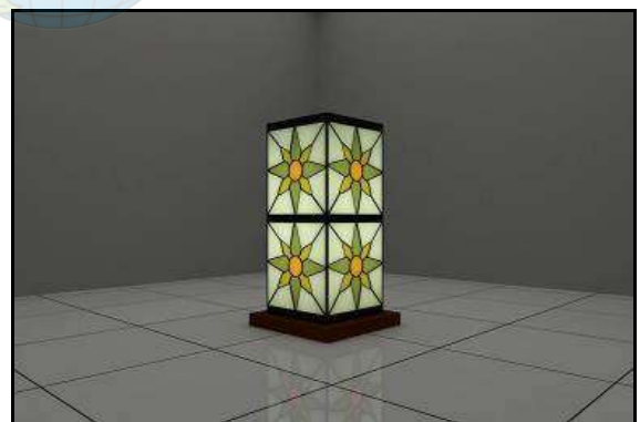
Gambar 08. Contoh desain table lamp minimalis, warna hijau, motif taruntum batik tradisional