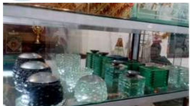
Gambar 15. Sebagian hasil produksi kerajinan kaca