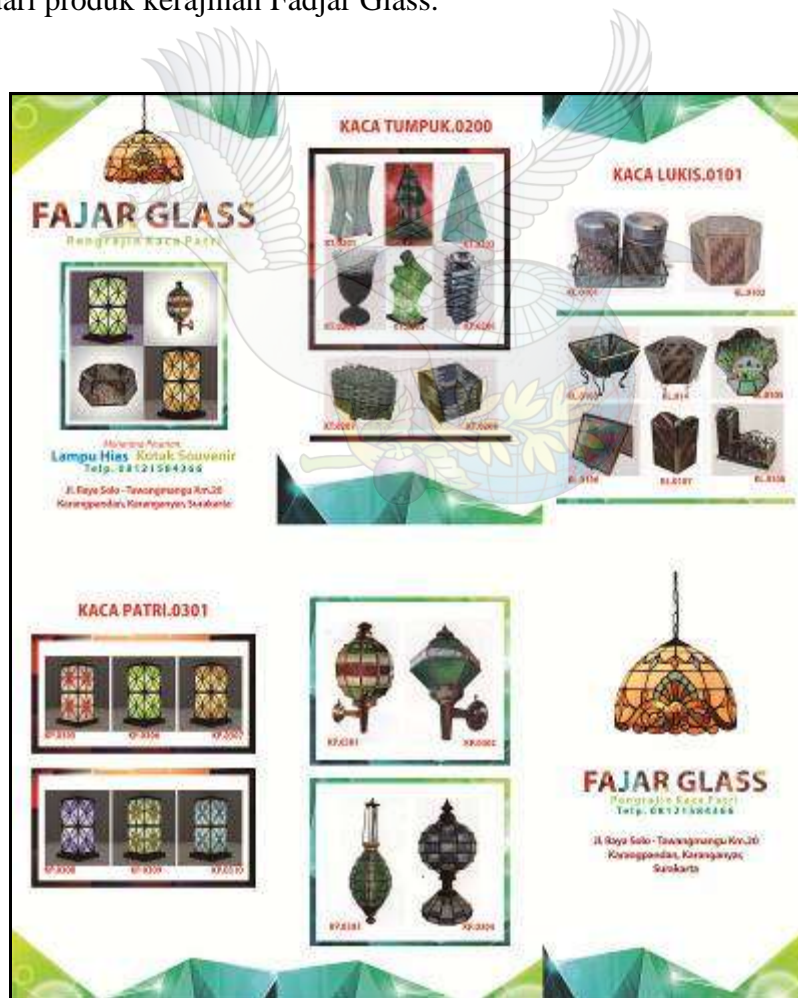
Gambar 09. Desain media promosi produk Fajar Glass berupa Brosur ukuran A4 lipat (dok. Penulis)

Pelatihan dan pembuatan materi publikasi dan promosi dilakukan agar produk dari mitra binaan dapet terserap oleh pasar, media yang digunakan berupa media offline dan online. Pada kegiatan pelatihan media promosi ini ini dihasilkan desain dan cetakan brosur/leaflet dari produk kerajinan Fadjar Glass.