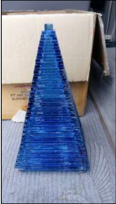
Gambar 16. Desain table lamp bentuk piramida berbahan kaca tumpuk