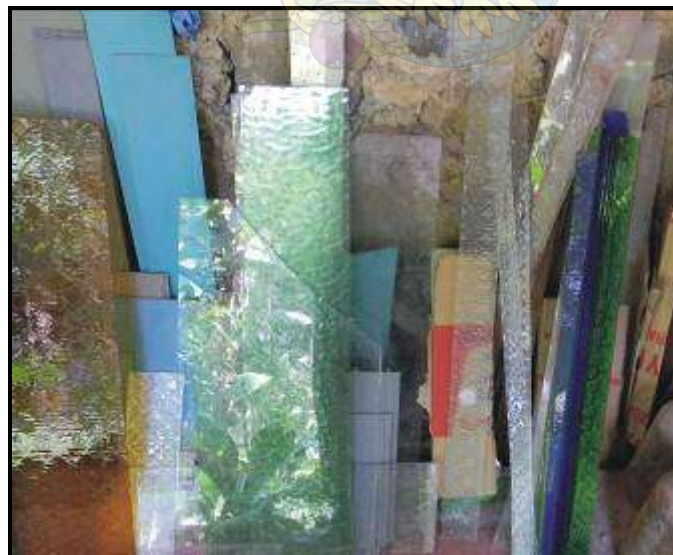
Gambar 01. Limbah kaca dari toko bahan bangunan yang dimanfaatkan oleh pengrajin lampu hias kaca “Fajar Glass” (dok. penulis)

Peluang pasar untuk produk lampu hias kaca ini masih sangat terbuka, baik untuk pasar lokal maupun pasar ekspor. Dalam beberapa kali kesempatan mengikuti ieven pameran yang difasilitasi oleh pemerintah Kabupaten Karanganyar, yakni PRPP Jateng (Pekan Raya Promosi Pembangunan Jawa Tengah) di Semarang 2010 dan Inacraf 2011 di JHCC Jakarta, terbukti sebagian besar produk laris terjual di pasar, akan tetapi pengrajin belum berani melakukan kontrak dagang, dikarenakan salah satunya adalah kapasitas produksi yang belum memadai serta desain yang masih konvensional. Proses produksi yang dilakukan oleh pengrajin ini adalah karena masih dikerjakan secara manual, tidak adanya alat bantu produksi yang memadai untuk mempercepat proses produksi sehingga jumlah lampu yang dihasilkan masih relative terbatas. Pembuatan knop sambungan penutup kaca patri berupa pembuatan cekungan kuningan masih menggunakan teknik manual (menggunakan palu dan betel) padahal knop tersebut dibuat dalam jumlah yang cukup banyak dalam setiap lampu, bisa puluhan bahkan ratusan, tergantung dari besar-kecil serta banyak-sedikit sudut yang ada pada lampu tersebut. Pada beberapa jenis pekerjaan tertentu masih dipekerjakan kepada bengkel lain ( punch bentuk lingkaran cekung dari rangka lampu hias kaca dari bahan kuningan) sehingga menambah biaya produksi.