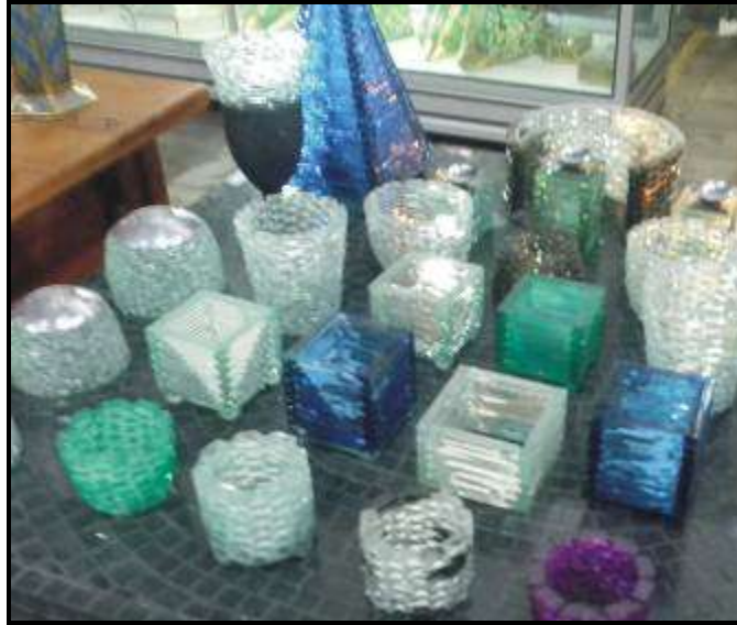
Gambar 04. Bentuk souvenir kaca yang bisa dikembangkan oleh dari “Candi Art” dari bahan limbah kaca lampu hias dan toko bangunan (dok. penulis)