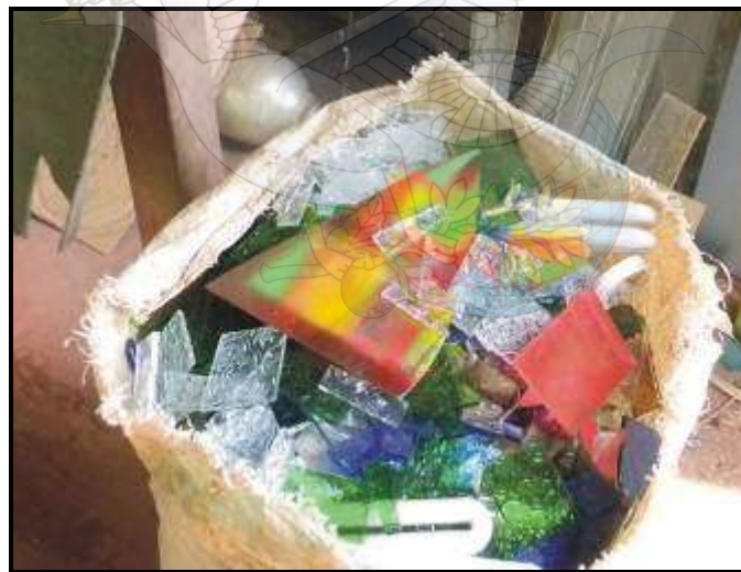
Gambar 03. Limbah kaca dari pengrajin lampu hias kaca yang dimanfaatkan oleh pengrajin souvenir “Candi Art”

Kerajinan souvenir “Candi Art” selama ini memanfaatkan sisa-sisa limbah yang kaca yang lebih kecil, baik limbah kaca dari para pengrajin lampu hias kaca maupun langsung dari limbah toko bahan bangunan. Penjualan pada awalnya sebatas dilingkungan daerah wisata, beberapa kesempatan produknya sempat ‘dititipkan’ pada pameran kerajinan tingkat provinsi maupun nasional, ternyata respon masyarakat cukup baik. Akan tetapi ada beberapa kendala dalam memenuhi pesanan dikarenakan tidak memiliki alat bantu produksi yang memadai, khususnya alat semprot cat agar warna lebih bervariasi, selama ini masih menggunakan cat semprot langsung dari kaleng/ aerosol spray paint , sehingga biayanya masih relative tinggi (setiap kaleng cat semprot Rp. 17.000,-/ 300 cc ). Desain yang ada juga perlu dikembangkan, selain sebagai souvenir kenang-kenangan wisata berupa bentuk-bentuk bangunan candi, bisa juga dikembangkan sebagai souvenir yang mempunyai nilai fungsi lebih, yakni sebagai elemen hias pendukung interior berupa stand candle / tempat lilin, ashtray / asbak, plant box / kotak pot tanaman hias dan lain sebagainya.