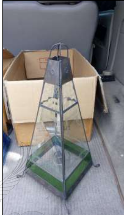
Gambar 17. Desain table lamp bentuk piramida berbahan kaca patri warna bening