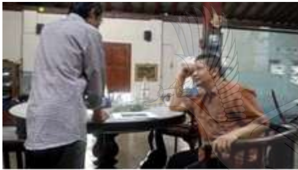
Gambar 12. Diskusi pengembangan desain