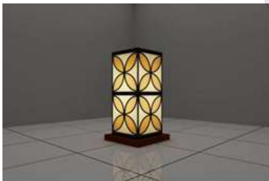
Gambar 07. Contoh desain table lamp minimalis, warna oranye, motif kawung batik tradisional (dok. Penulis)

Koordinasi dilakukan dengan pengrajin terkait dengan implementasi program kegiatan pengabdian masyarakat. Pemilihan waktu agak terjadi kesulitan karena kesibukan mitra kegiatan. Setelah dilakukan beberapa kali komunikasi maka dapat dilaksanakan kegiatan pada bulan Juni.