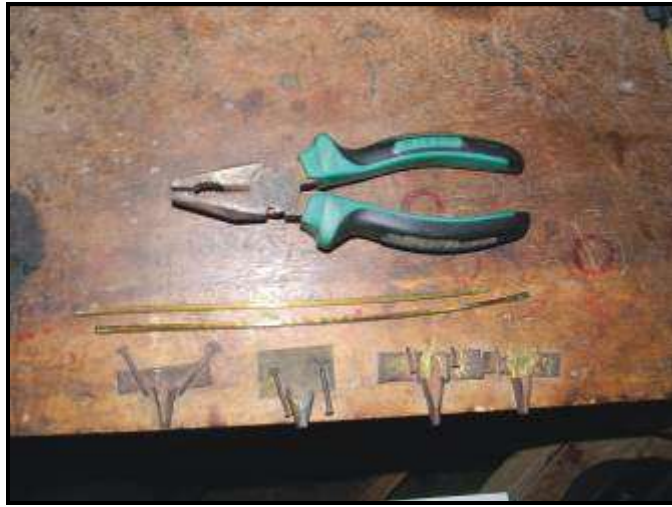
Gambar 05. Alat bantu produksi yang masih sederhana, berupa tang penjepit dan mal dari rangka besi yang dibuat sendiri untuk membuat rangka lurus kuningan (dok. penulis)

Berdasarkan observasi awal dari data-data yang ada dilapangan oleh tim pengusul dari Institut Seni Indonesia (ISI) Surakarta untuk menggali segala potensi dan permasalahan dari para pengrajin berbasis bahan limbah kaca dapat dilihat pada gambar di bawah ini.