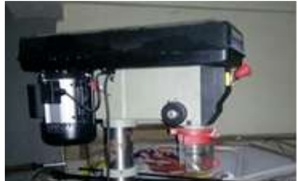
Gambar 11. Introduksi mesin teknologi tepat guna meningkatkan produktifitas