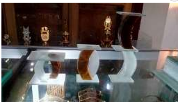
Gambar 14. Sebagian hasil produksi kerajinan kaca