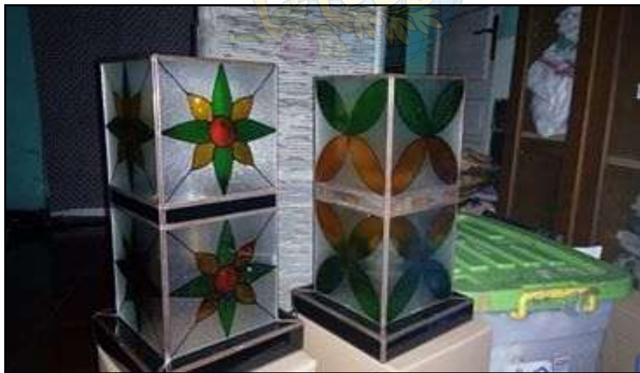
Gambar 18. Hasil pengembangan desain dengan motif batik tradisional kawung dan taruntum