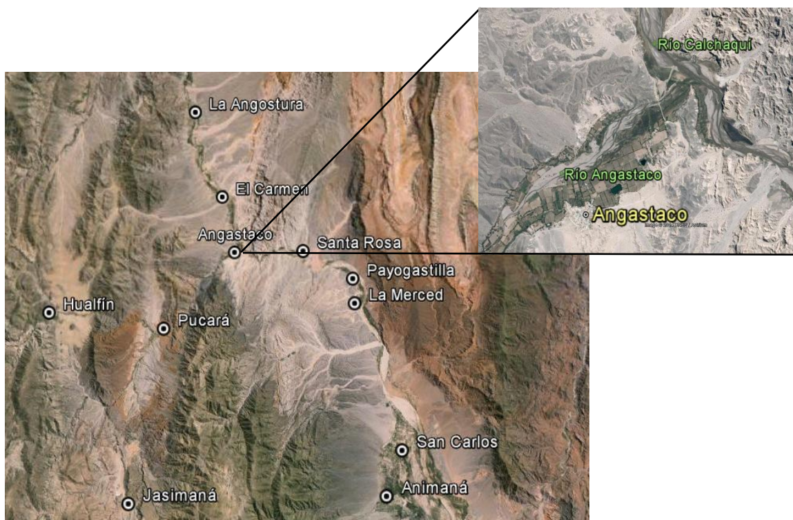
Figura n° 3: Imagen aérea de la región sur del Valle Calchaquí Salteño

El departamento San Carlos limita al norte con los departamentos Cachi y Chicoana, al oeste con Molinos, al este con los de Cafayate y La Viña y al sur con la provincia de Catamarca y el departamento Cafayate (Ilustración n° 1). Tiene una superficie de 5.125 km 2 con una población de 7.016 (7.208 habitantes en el 2001 y 5.650 en el 1869) habitantes, lo cual representa una densidad poblacional de 1,24 hab/km 2 (CNPhyV, INDEC, 2010), ubicándose entre los cuatro departamentos menos poblados de la provincia. El total de la población del departamento es de tipo rural. El municipio de Angastaco es uno de los tres del departamento junto a San Carlos y Animaná, tiene una población dispersa de 2.518 habitantes. Este municipio incluye los parajes Pucará, Santa Rosa, La Cabaña, La Arcadia, El Carmen, La Angostura y Jasimaná (Ilustración n° 2) que incluye a los parajes Los Cardones, El Arremo, Pampa Llana y Río Grande. Muchos de los cuales son fincas grandes dentro de las que viven numerosas familias que trabajan como medieros de los dueños de la tierra.