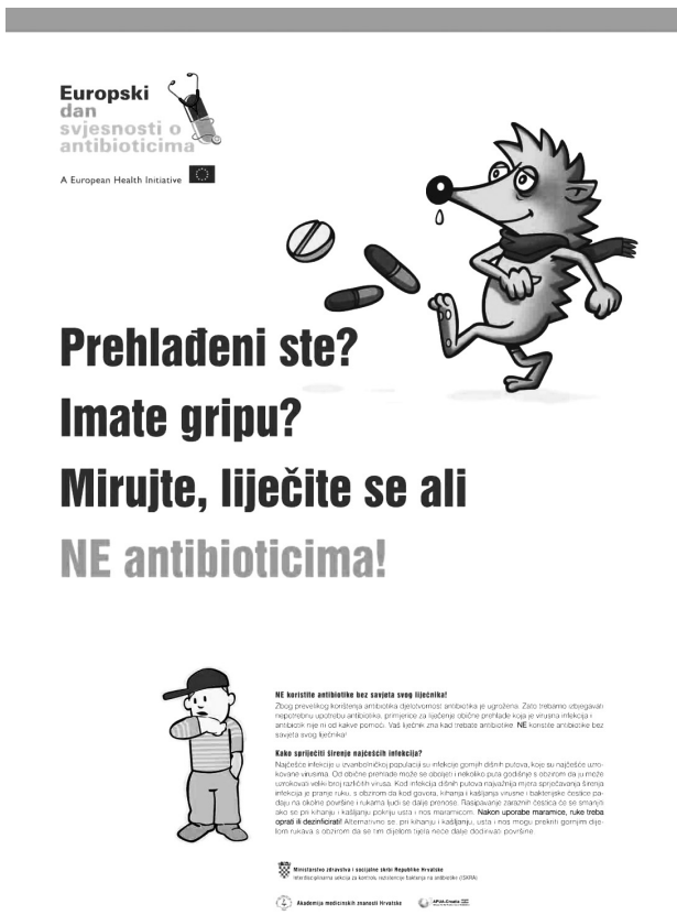
Slika 2. Edukativni letak za građane o nužnosti racionalnije primjene antibiotika Figure 2. Public educative leaflet about the necessity for rational antibiotic usage

Awareness Day, EAAD), koji je u mnogim zemljama Europe, pa tako i Hrvatskoj prikladno obilježen. Na sam dan održan je Simpozij povodom obilježavanja EAAD u Zagrebu, a tijekom studenog i prosinca održano je i nekoliko znanstveno-stručnih sastanaka na tu temu u drugim hrvatskim gradovima. U sezoni učestalih respiratornih infekcija u kojoj se najčešće bespotrebno propisuju antibiotici, podijeljeno je 2008./2009. g. ordinacijama primarne zdravstvene zaštite i ljekarnama 10 000 postera i 200 000 informativnih letaka za građane (slika 2). U zimskoj sezoni 2009./2010. g. javna kampanja je upotpunjena televizijskim i radio spotovima na temu nepotrebne uporabe antibiotika. Bolja edukacija kako djelatnika u zdravstvu tako i građana najvažniji je put očuvanja djelotvornosti antibiotika.