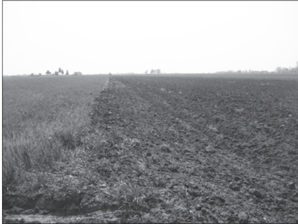
Sl. 4. Golinci-Ograd