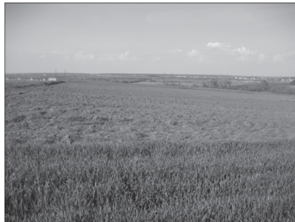
Sl. 3. Šipovac-Ribnjak

Fig. 2 Velika Londžica-Malo polje 3