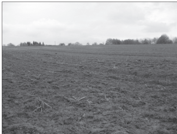
Sl. 2. Velika Londžica-Malo polje 3

Fig. 2 Velika Londžica-Malo polje 3