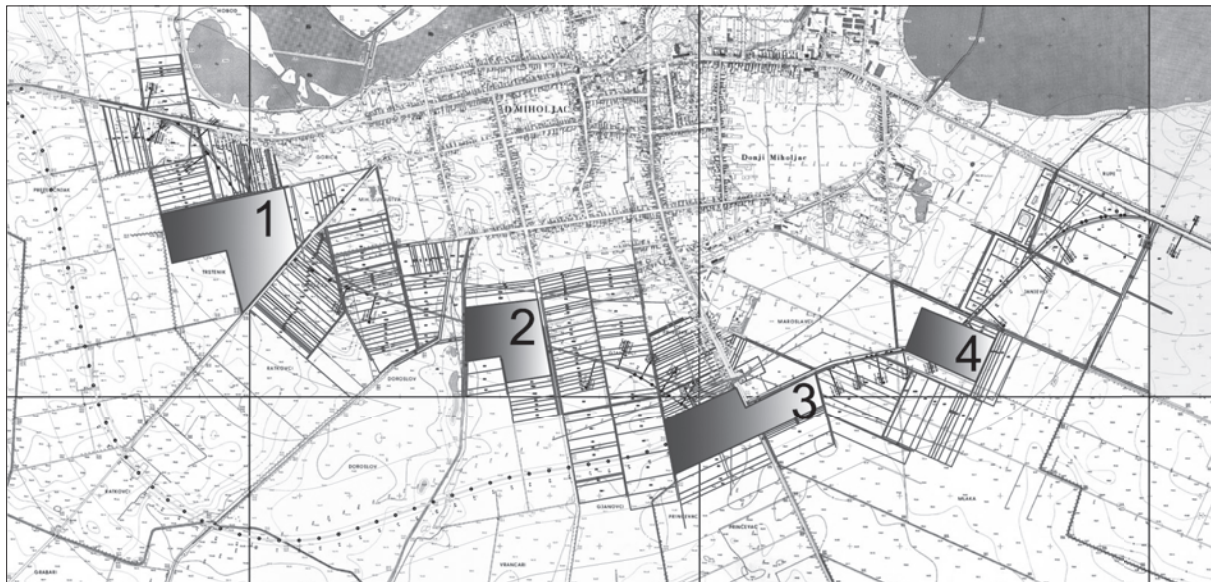
Karta 1. Arheološki lokaliteti na trasi južne obilaznice grada Donjeg Miholjca: 1) Donji Miholjac – Trstenik, 2) Donji Miholjac – Za ogradom i Vrancari, 3) Donji Miholjac – Mlaka-Trafostanica, 4) Donji Miholjac – Mlaka

Map 1 Archaeological sites on the route of the southern Donji Miholjac bypass: 1) Donji Miholjac-Trstenik, 2) Donji Miholjac - Za ogradom and Vrancari, 3) Donji Miholjac - Mlaka-Power Transformer Station, 4) Donji Miholjac-Mlaka