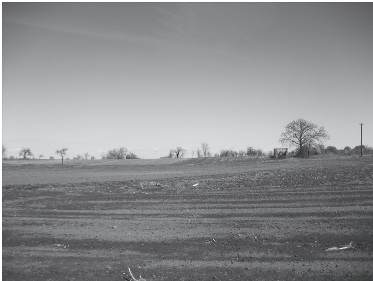
Sl. 2. Sotin – Srednje polje, pogled prema sjevernom dijelu gdje se nalazi eneolitičko i željeznodobno naselje

1 Sotin-Fancage; 2 Sotin-Gradina; 3 Sotin-castellum; 4 Sotin-Vrućak; 5 Sotin-east of school; 6 Sotin-Srednje polje; 7 Sotin-Vašarište