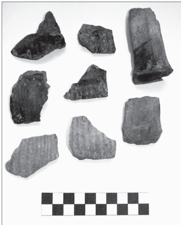
Sl. 3. Sotin-Srednje polje, sjeverni dio, ulomci daljske keramike