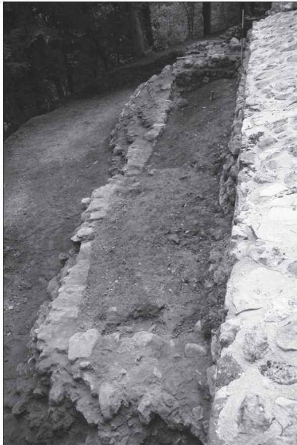
Sl. 4. Pogled od sjevera na sloj SJ 176 na prostoru omeđenom zidovima i nizom okomito ubadanih drvenih kolaca