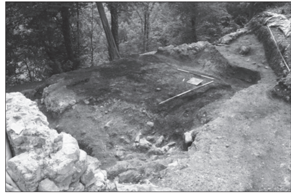
Sl. 2. Pogled sa sjevera na sjevera na izgorjeli drveni objekt iz 16. stoljeća (faza SJ 173)

Fig. 1 Find of a horse bit on the slopes of the plateau, at the point where layers SU 073/SU 175 meet