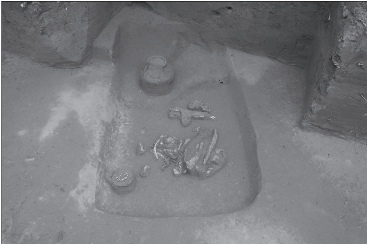
Sl. 3. Grob LT 74 Fig. 3 Grave LT 74

Rezultati istraživanja 2008. godine potvrdili su iznimno značenje nalazišta Zvonimirovo-Veliko polje, čije bi istraživanje trebalo i ubuduće nastaviti, posebno u sjevernije položenim