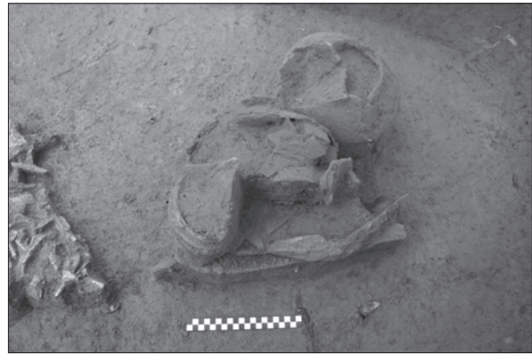
Sl. 2. Grob LT 73 – kantharos položen na bok Fig. 2 Grave LT 73 – kantharos, laid on its side

44, sl. 2.), zatim fibula s rombično raskucanom pločicom na kraju luka (Teržan 1975) te fibula tipa Mötschwil. Zanimljive su i brončane fibule srednjolatske sheme kod kojih se prebačena nožica za luk prihvaća s nekoliko navoja. Nakitu pripadaju prilozi željezne narukvice te spaljeni ostaci staklenih narukvica. Ipak, od posebne je važnosti nalaz cijele staklene narukvice od bezbojnog stakla sa žutom folijom na unutarnjoj strani u grobu LT 70 koja predstavlja jedinstveni nalaz u sjevernoj Hrvatskoj (sl. 1.). Slične narukvice te spomenute brončane fibule zabilježene su na jugoistočnoalpskom prostoru, najčešće kod Tauriska, a Zvonimirovo je njihova najistočnija točka rasprostranjenosti. Narukvica iz groba LT 70, s obzirom na oblik i boju stakla od kojeg je napravljena, može se pripisati narukvicama serije 25 koja je karakteristična za LT C2 (Dizdar 2006, 81). Također, u grobu LT 71 pronađen je niz perli od kobaltnoplavog i bezbojnog stakla te jedna veća kobaltnoplava perla koja je ukrašena s četiri bijelo izvedena motiva oka.