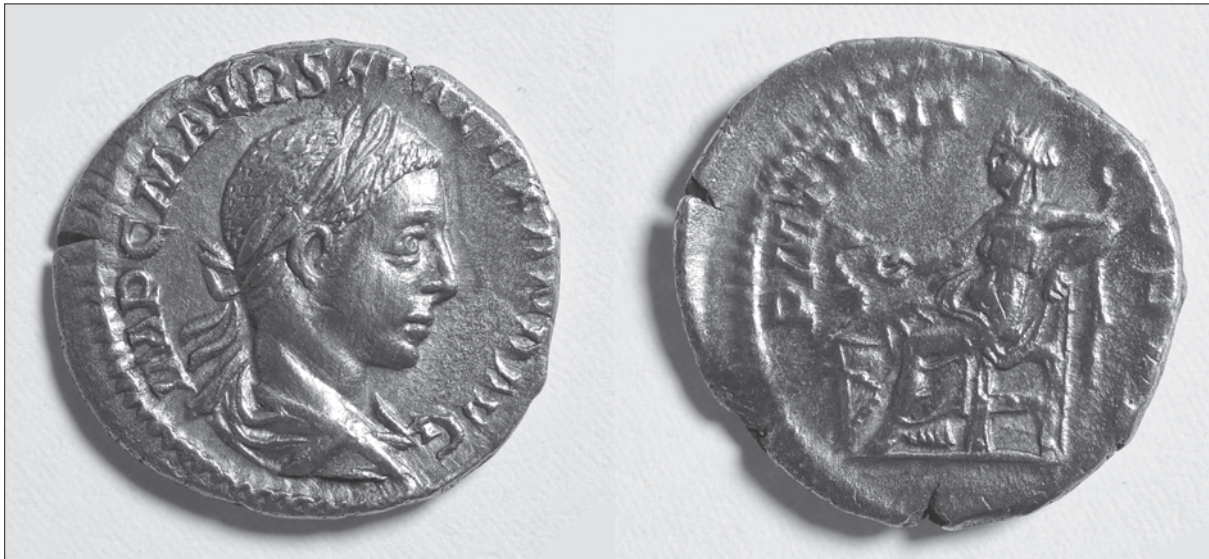
2. Aleksandar Sever (222. – 235.). Avers: IMP C M AVR S(EV) (ALEXAND) AVG, Revers: P M TR P II (COS P P) 2. Alexander Severus (225-235). AV: IMP C M AVR S(EV) (ALEXAND) AVG REV: P M TR P II (COS P P)