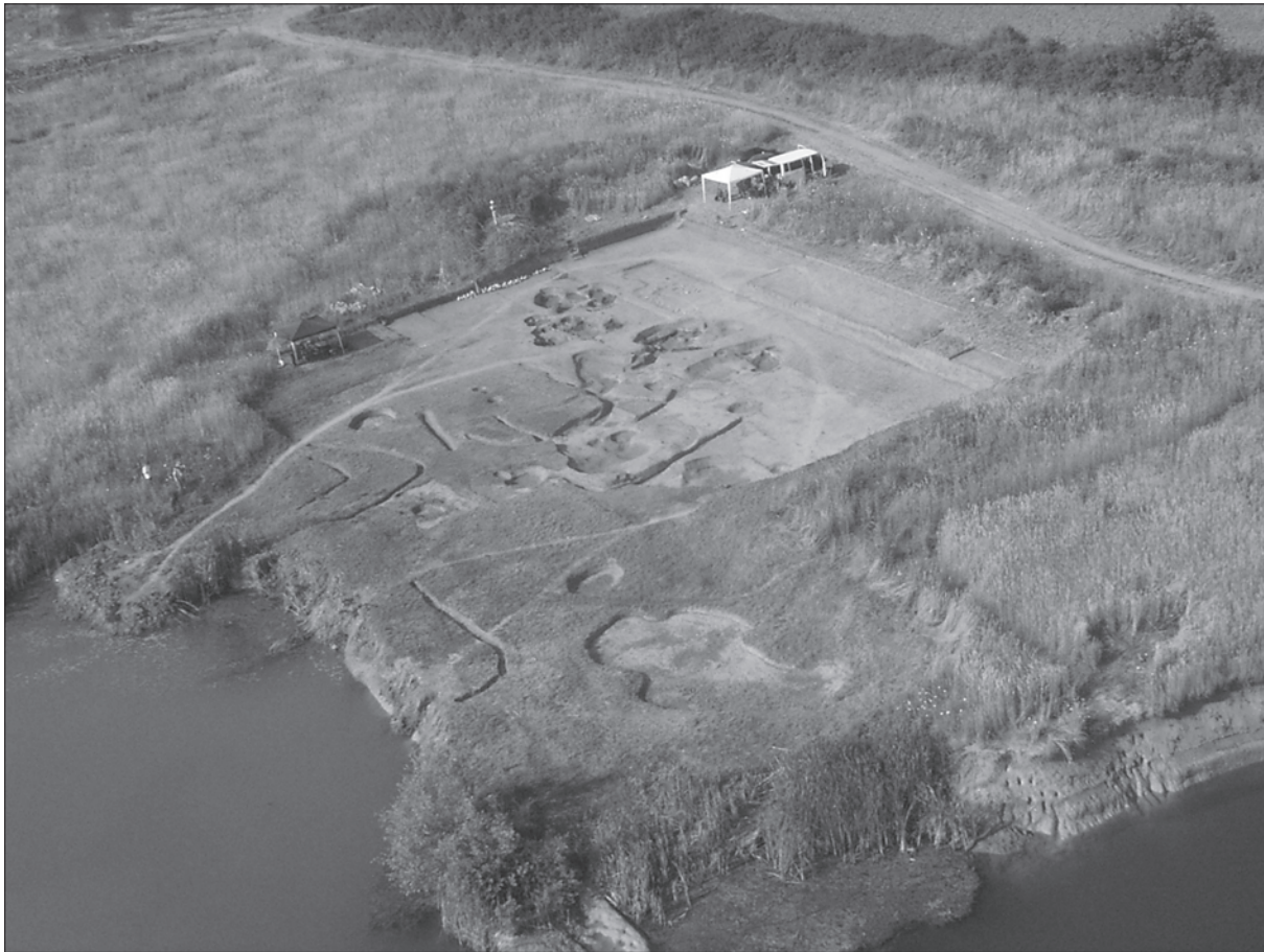
Sl. 1. Slavonki Brod, Galovo, zračni snimak arheološkog lokaliteta

Fig. 1. Slavonki Brod, Galovo, aerial photo of the archaeological site