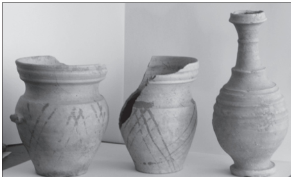
Sl. 6. Bektinci, Bentež, lonac, vrč i boca fine gotičke keramike kasnosrednjovjekovnog naselja