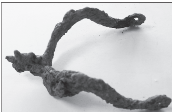
Sl. 7. Bektinci, Bentež, gotička zvjezdasta ostruga kasnosrednjovjekovnog naselja