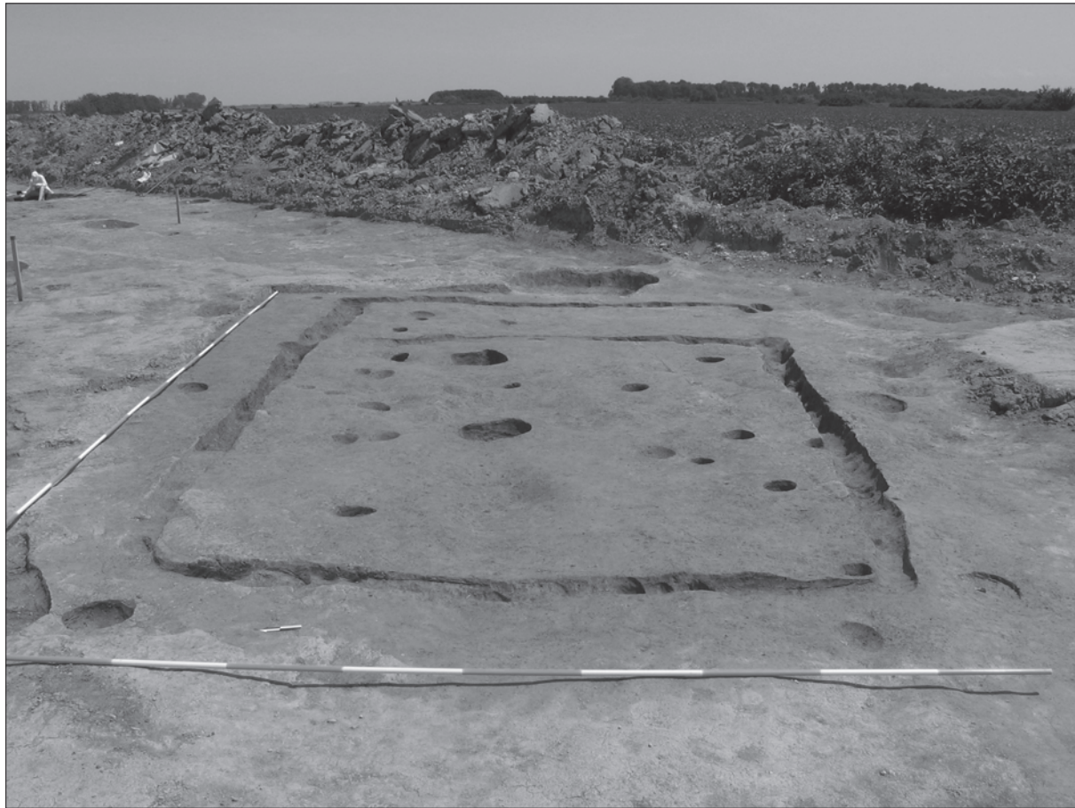
Sl. 1. Beketinci, Bentež, nadzemna kuća 3 u naselju lasinjske kulture