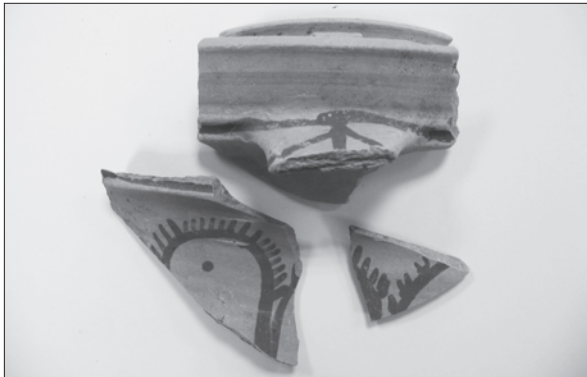
Sl. 5. Bektinci, Bentež, dio vrča fine slikane gotičke keramike kasnosrednjovjekovnog naselja