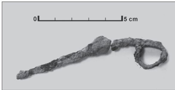
Sl. 8. Beketinci, Bentež, dio škara iz kasnosrednjovjekovnog naselja

Fig. 8 Beketinci, Bentež, a part of scissors from the Late Medieval settlement