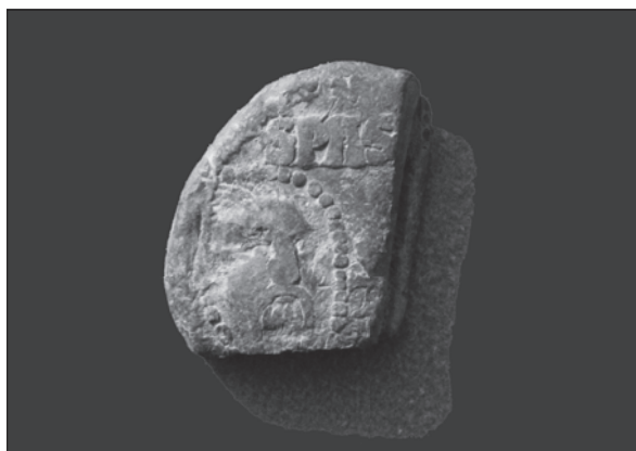
Sl. 9. Beketinci, Bentež, avers papinskog pečata od olova – papa Grgur XI., 1370.-1378.g.

Fig. 8 Beketinci, Bentež, a part of scissors from the Late Medieval settlement