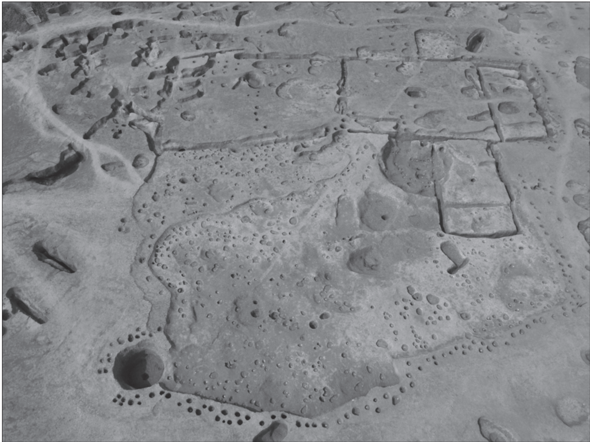
Sl. 2. Beketinci, Bentež, velika nadzemna kuća 4 s manjom nadzemnom kućom 5 i velikim dvorištem (zemunicom) s bunarom u naselju lasinjske kulture