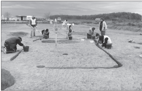
Sl. 4. Bekerinci, Bentež, drveni temelji kuće u središtu kasnosrednjovjekovnog naselja