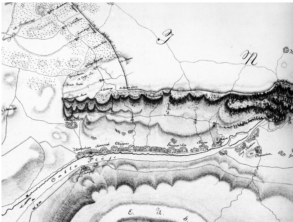
Slika 3: Karta sanitarnog kordona iz 1821. godine (Taborović) - detalj karte područja ušća rijeke Omble kod Dubrovnika (kordoni su označeni brojčanim oznakama)