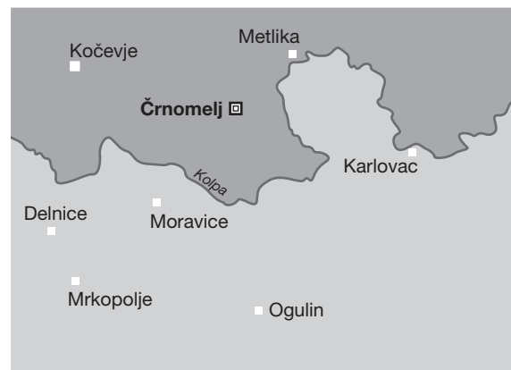
Slikovna priloga 1: geografska lega Črnomlja

Beli krajini, nedaleč od hrvaške meje, ni nikoli veljalo za posebej bogato in obetavno kranjsko mesto. Ležalo je na stranski cestni povezavi proti Vojni krajini in je vseskozi zaostajalo za svojim sosedom, precej večjim mestom Metlika tik ob hrvaški meji, skozi katero je tekla glavna prometnica od Novega mesta do Karlovca. Črnomaljsko prebivalstvo je tako v veliki meri živelo od agrarnega gospodarstva in premoglo le skromno obrtno in trgovsko dejavnost. Zgovorno je dejstvo, da med sedmimi mesti Dolenjske samo za