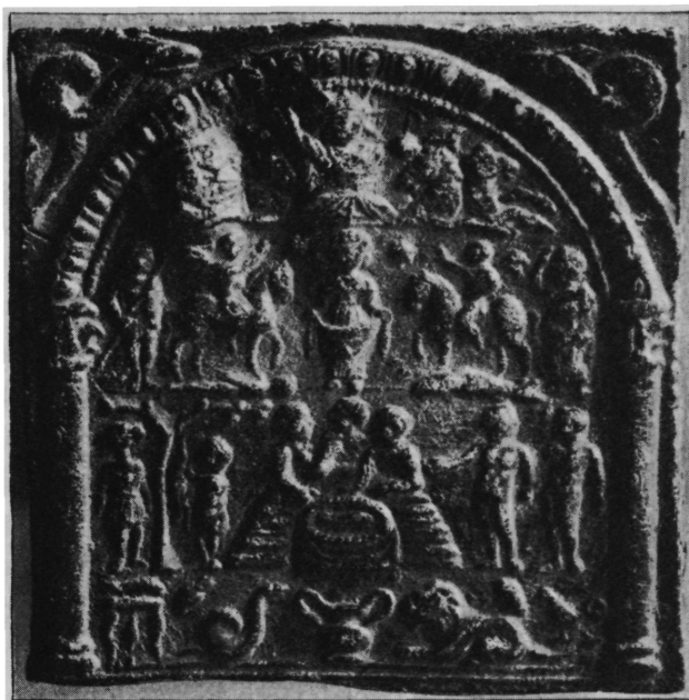
Sl. 5. Olovna pločica iz Mitrovice (br. 13). Nar. vel.

pregom. Iz ovoga su pojasa ma-knute i zvijezde i metnute u drugi pojas, uz glavu svakoga jahača po jedna. U drugom pojasu novo je to, što lijevi jahač stoji na ispruženom čovječjem tijelu, a desni na ribi; kod prijašnjega tipa stoje obadva muškarca, i onaj koji guli životinju, a i onaj s oinovom glavom, lijevo od drva, na ovoj pločici je drvo između obojice. U najdonjem pojasu poredak je u toliko drugačiji, što je lijevo od posude zmija, a desno lav, dok je kod prijašnjega tipa bilo obratno. Kada sam objelodanio zadnju olovnu pločicu u IX svesci nove