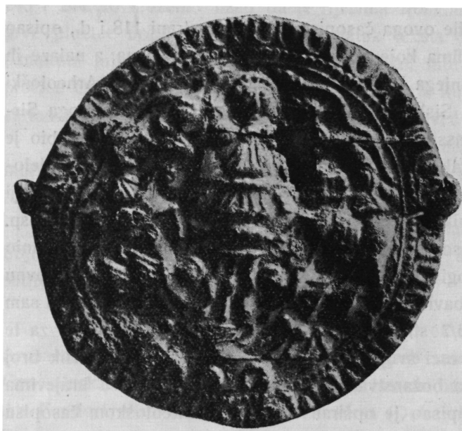
Sl. 1. Olovna pločica iz Popinaca (br. 9). Nar. vel.

primjeraka, pa je brižnim istraživanjem došao do vrlo važnih novih rezultata. Do njegove publikacije proći će još dosta vremena, pa kako će u njoj važnu rolu igrati i primjerci zagrebačkoga muzeja, to je potrebno da se ti novo nadošli komadi objelodane u ovome časopisu.