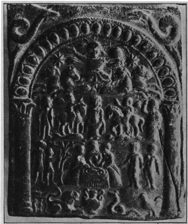
Sl. 4. Olovna pločica iz Dalja (br. 12). Nar. vel.

Oko stola, na dušek (t. zv. sigma) sjede tri muškarca. S desne strane dolaze stolu dva gola muškarca, od kojih jedan vodi drugoga za ruku. Lijevo od stola drvo, na koje je obješena zaklana životinja (ovan), s otsječenom glavom. Jedan muškarac u prepasanom radničkom odijelu guli ju, ili joj vadi utrobu, a drugi muškarac, u jednakom odijelu, s ovnovom glavom na svojoj glavi, posmatra taj prizor. U donjem, četvrtom pojasu, u sredini kantaros. K njemu dolazi s lijeva lav, s desna zmija. Sasvim lijevo tronožni stol s ribom, a desno pijetao. U gornjim uglovima pločice, nad edikulom, lijevo i desno po jedna zmija.