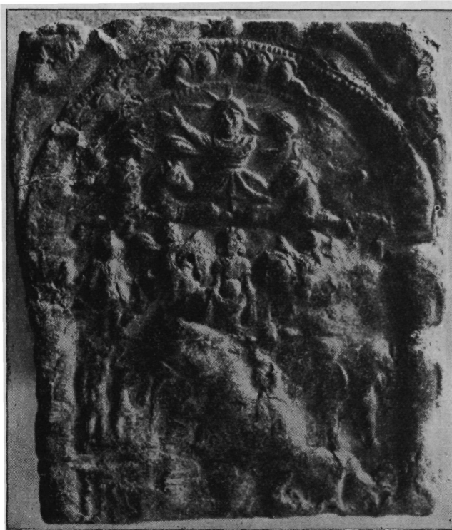
Sl. 3. Olovna pločica iz Novih Banovaca (br. 11). Nar. vel.

kojemu s lijeva prilazi kokot, a s desna četveronožac (valjda lav); sasvim dolje tri hljeba. Ovo je prvi cijeli primjerak ovoga tipa. Publicirao ga je, po našoj fotografiji M. Rostovcev u spomenutoj radnji tabla III br. 4. Nažalost je slika tamo preokrenuta. Jedan fragmenat toga tipa nalazi se u Madžarskom narodnom muzeju, a objelodanio ga je Hampel u „Archeologiai Értésítő“ XXIII 1903 str. 359. Odavde sam ga preuzeo u „Vjesnik“ n. s. VIII str. 125 sl. 8. Važno je, da se za taj primjerak navodi da je nađen između Putinaca i Indije, dakle također na teritoriju stare Basijane. Prema tome imade naš muzej sa toga teritorija tri komada, a u Pešti se nalazi četvrti. Dva su primjerka od toga sasvim jednaka. Po svojoj prilici je tu bio jedan centar toga kulta.