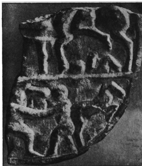
Sl. 6. Ulomak mramorne pločice iz Kupe kod Siska (br. 14). Nar. vel.

14. Desni donji dio okrugle mramorne pločice, sada visok 102, širok do 85, a debeo do 7 mm. Nađen je u Kupi kod Siska prilikom jaružanja u oktobru godine 1913. Od relijefa sačuvani su ostaci od dva pojasa, koji su odijeljeni debelom povišenom crtom. U gornjoj zoni sačuvan je tronožni stol, koji je stajao sigurno u sredini, a na njem riba. Sačuvan je velikim dijelom i desni jahač koji dolazi stolu jašući preko ležećega muškarca. Taj leži