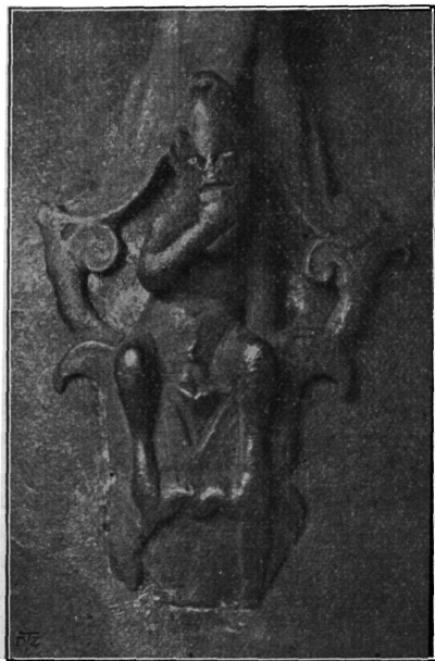
Sl. 121. Dolnji kraj ručke bronsanoga rimskoga vrča iz Gušća. Nar. vel.

Rimska bronsana posuda iz Gušća. Godine 1911. poklonio je konservator zemaljskoga povjerenstva za očuvanje umjetničkih i histo-