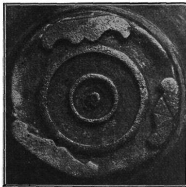
Sl. 122. Dno rimskoga bronsanoga vrča iz Gušća. \frac{2}{3} nar. vel.

Posuda je bila dugo u porabi. To se vidi na ručki, koja je jako izlizana, a to se nije dogodilo tek uslijed valjanja po vodi. Još je za to sigurniji znak dno, koje je još u staro vrijeme bilo popravljano. Samo dno se doduše nije moglo izlizati, jer su tu bile dosta debele karike, ali je posuda morala biti tim slabija odmah povrh dna, jer je tu pritisak kola veoma velik. Vremenom se je tu posuda istrošila, te je istrošeni dio posude između trbuha i dna posude izrezan, a dno na zdravi dio pritaljeno. Moglo bi se doduše pomisliti i na to, da se je prikralo i dno od druge posude, nu vidi se, da je bronsa sasvim ista, a ako se je rub dna malo kladivcem izlupao, lako se je mogao toliko proširiti, da je pristajalo na posudu, koja je sada dolje bila nešto šira. Ovakvi vrčevi, koji su na dnu bili provideni jakim karikama, nisu osim toga trebali imati pritaljene posebne kovne pločice, jer su već same karike bile dovoljna zaštita protiv istrošenja dna. Tako i ovaj vrč iz Gušća po svoj prilici nije iz početka imao na dnu takvih pločica. Tek kod popravka stanjio se rub dna, malo se iskrivio, a uslijed toga je i stabilitet posude bio manji. Zato je majstor, koji je posudu popravljao, pritalio tri bronsane pločice slične kresalima, koje su, kako se na priloženoj slici (122) vidi, sasvim različite, a sigurno je, da ni jedna od njih nije bila na posudi, kada je izašla iz fabrike. Za pritaljivanje