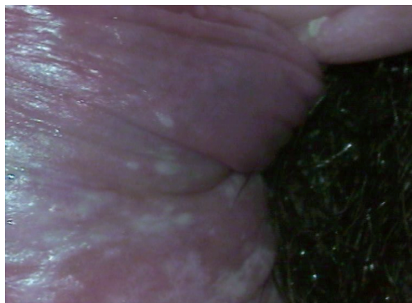
Slika 1. Ravni kondilomi

Danas se za dijagnostiku latentne infekcije HPV-om upotrebljavaju samo metode molekularne dijagnostike. One se temelje na visokoj osjetljivosti (npr. mogućnost što točnije identifikacije osoba s bolešću) i visoke specifičnosti (npr. mogućnost što točnije identifikacije osoba koje nemaju bolest). Molekularne metode za detekciju DNK bazirane su na hibridizaciji nukleinskih kiselina. Probe mogu biti značajne za određeni genotip (genotip-specifične probe) ili za više genotipova HPV (grupno-specifične probe). Danas se najčešće upotrebljavaju hibridizacija HPV DNK, lančana reakcija polimerazom (PCR), in situ hibridizacija i rjeđe i ostale molekularne tehnike tipizacije DNK (metoda dot-blot, metoda hibridizacije po Southern ili Southern-blot).