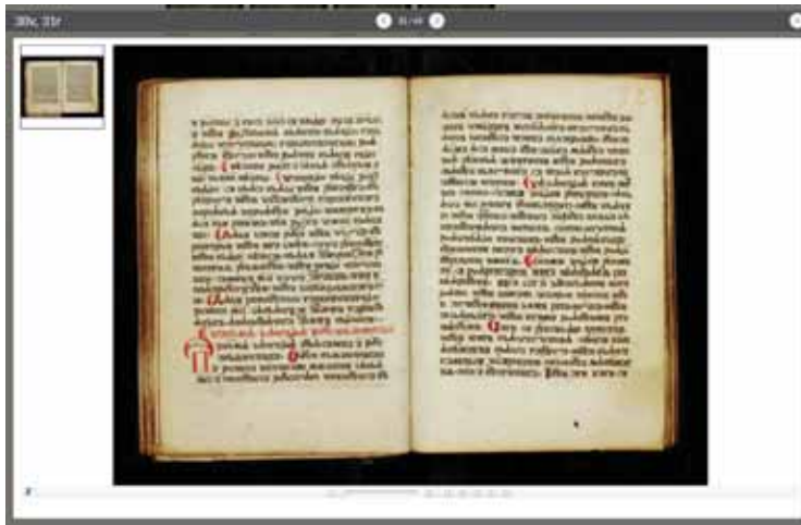
Slika 4.: Prikaz digitalne slike spomenika na zaslону, i ekrančić u gornjem lijevom uglu ( Ivančičev zbornik , 14-15. st., ff. 30v-31r).

visokoj rezoluciji. Posjedujemo 238 web kopija. Uglavnom su crno-bijele, budući da su nastale digitalizacijom crno-bijelih fotografija, fotokopija i mikrofilmova, odnosno, riječ je o digitaliziranim crno-bijelim kopijama izvornika ili kopiji kopije. Druge su djelomično ili čitave u boji, a dobivene su skeniranjem ili digitalnim fotografiranjem izvornika. Moguće je imati više verzija istog izvornika na intranetu , od kojih neke mogu biti u boji, a neke crno-bijele (što ovisi o kopiji izvornika koja se digitalizira), kao i da neki dokument bude digitaliziran i u boji i crno-bijelo (na primjer, isti rukopis može biti crno-bijeli, a samo nekoliko snimaka u boji). Svim snimkama moguće je dodijeliti broj stranice, na primjer: 1r, 4v, 0001 ili bilo koji drugi tekstualni zapis, koji služi identifikaciji stranice ili dijela teksta u izvorniku. Administrator programa može upisati i napomenu za svaku dotičnu sliku, koja se ispisuje ispod snimke kod njezinog pregleda. Ispod slike dokumenta (Slika 4.) nalaze se navigacijske tipke gore , dolje , lijevo , desno , reset i zoom , za prilagođavanje slike na ekranu radi bolje čitljivosti manje vidljivih ili prostim okom teže uočljivih detalja. Pritom se, u gornjem lijevom uglu, nalazi mali preview ekran s trenutnim prikazom položaja dijela teksta koji se upravo vidi na zaslону, a u odnosu na cijelu snimku.