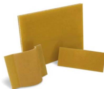
SLIKA 20 - Kompozit Ultem

Kompoziti Ultem (slika 20) smanjuju težinu i cijenu proizvoda, mogu zamijeniti aluminij i duromere u zrakoplovnoj i elektroničkoj industriji te balistici. Visoke su žilavosti, lagani, slabo su zapaljivi, niske toksičnosti i sadržaja vlage, dobre čvrstoće, a proizvodi se mogu upotrebljavati pri visokim temperaturama. Kompoziti Ultem uz primjenu tekstila načinjenoga od Ultem vlakana i pjene ili jezgre pčelinjih saća, mogu sniziti cijenu proizvoda i povećati fleksibilnost proizvodnje. Takvi kompoziti mogu se toplinski oblikovati i rezati na manje dijelove te primjenjivati za interijer i eksterijer zrakoplova.