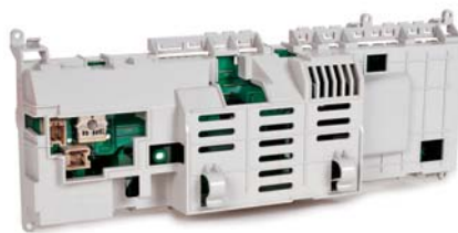
SLIKA 22 - Držak kontrolne ploče stroja za pranje rublja

Tvrtka Vestel za izradbu držača kontrolne ploče u perilicama rublja više ne rabi halogeni poliamid, već novi materijal, Noryl NH6020 proizvođača SABIC Innovative Plastics (slika 22). Time je poboljšana kvaliteta kontrolne ploče (dobra dimenzijska stabilnost), sniženi su troškovi, manje se opterećuje okoliš i veća je sloboda pri konstruiranju i dizajniranju proizvoda.