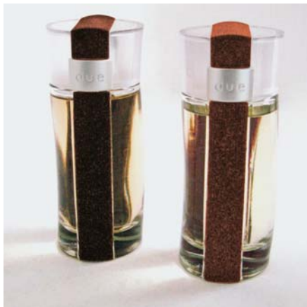
SLIKA 18 - Ambalaža za parfeme

bilnosti proizvoda. Materijal se može ekstrudirati i injekcijski prešati, a najčešće se od njega izrađuje ambalaža za kozmetiku (slika 18).