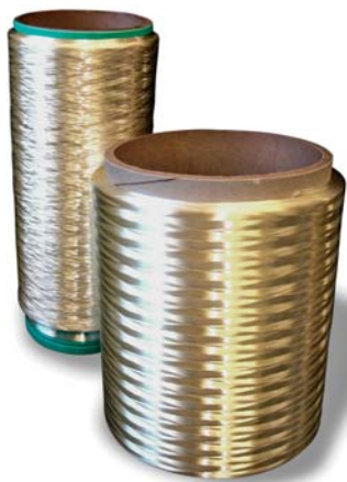
SLIKA 21 - Vlakna Ultem

Vlakna Ultem (slika 21) omogućuju odličan izgled površine izratka. Od njih se najčešće izrađuju sagovi i presvlake sjedala te stijenke zrakoplova i drugih transportnih sredstava, ali i namještaj, madraci, proizvodi kod kojih se zahtijeva visoka toplinska postojanost. Rabe se i za zaštitnu vojnu te sportsku odjeću. Vlakna zadovoljavaju stroge zahtjeve nezapaljivosti, netoksičnosti (u njima nema halogenih i drugih dodataka), temperaturno, kemijski i UV su postojana. Primjenom postupka pređenja vlakana iz taljevine mogu se načiniti monofilamenti, multifilamenti i vlakna u raznim bojama.