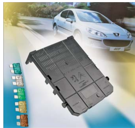
SLIKA 23 - Kućišta za osigurače

Zbog dimenzijske stabilnosti i odlične postojanosti na kemikalije, Arnite PBT/PET , u kojem je umjesto PPA smiješan PET, rabi se za kućišta za osigurače (slika 23), poklopce električne kontrolne jedinice i osjetila. Arnite TV8 260 upotrebljava se npr. za kućište zupčanika stražnjega brisača, jer je dobre hidrolitičke postojanosti. Time se povećava otpornost na zamor materijala. Arnite TV4 461 je PBT/PET materijal ojačan s 30 % staklenih vlakana, što smanjuje vitoperenje proizvoda i jamči dobra mehanička svojstva. Rabi se za izradbu optičkih dijelova, npr. senzora za kišu. Arnite TV6 241T je PBT materijal ojačan s 20 % staklenih vlakana, toplinski je postojan te je pogodan za dvostupnjevito injekcijsko prešanje.