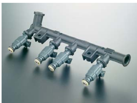
SLIKA 19 - Cijevi i ventili za biogorivo

Suradnja europskoga i brazilskog tima tvrtki PSA , Magneti Marelli i Rhodia dovela je do izradbe novog materijala Technyl A 218 V30 , poliamida 66 (PA66) ojačanoga staklenim vlaknima. Materijal je razvijen za potrebe izradbe dijelova motora na biogorivo za Citroën C4 i C5 , Peugeot 407 , 307 i 308 (npr. držači za cjevovode zraka, cijevi i ventili za gorivo (slika 19) itd.). Materijal je postojan pri visokim temperaturama, crne je boje i primjenjiv je i za mnoge druge proizvode u automobilskoj industriji.