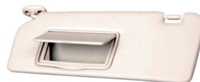
SLIKA 17 - Proizvod načinjen od biokompozita s kuraua vlaknima

Prvi od tih biokompozita je LNP Thermo-comp PX07444 , poliamid 6 (PA6) ojačan s 20 % kuraua vlakana. Biljka kuraua pripada vrsti bromelija, koje se uzgajaju u Južnoj Americi, a vlakna se izvlače iz lišća te su mehanički vrlo čvrsta. Vlakna su vrlo dobrog omjera čvrstoća/masa, dobre su površinske hrapavosti te snižuju abrazijsko trošenje i nastanak napuklina u kalupima za preradu tih materijala u usporedbi sa staklenim vlaknima i mineralnim punilima. Biokompoziti s kuraua vlaknima mogu se upotrijebiti za proizvodnju automobilskih dijelova (slika 17).