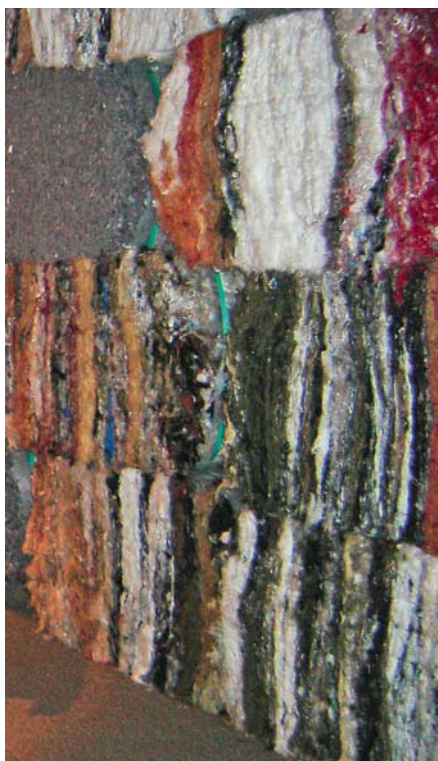
SLIKA 2 - Bale recikliranih tekstilnih vlakana različitoga sirovinskog sastava

proizvodi su pređe od mješavine engleske i kineske konoplje i recikliranog traperera. Uz ostala reciklirana vlakna, proizvode mješavine vune, kašmira, svile i PET-a dobivenoga mehaničkim recikliranjem PET boca.