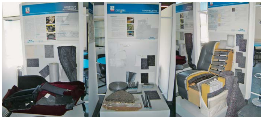
SLIKA 1 - Dio asortimana tvrtke Regeneracija , Zabok – tekstil od recikliranih tekstilnih vlakana za automobilsku industriju, graditeljstvo i industriju namještaja

Tvrtka Evergreen proizvodi pređe i tkanine od recikliranih vlakana. 4 Njihovi najuspješniji