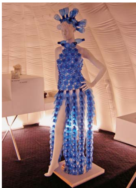
SLIKA 3 - Model odjavnog predmeta izrađenoga od PET boca na izložbi Futuro-textiel 2008 , Kortrijk, Belgija

– potrebna energija za recikliranje znatno je manja nego za proizvodnju PET-a iz sirovina uz istodobno nižu emisiju CO 2 , 6 uz razvijanje mogućnosti recikliranja PET boca i drugih proizvoda s odlagališta. Iskorištavanje PET boca otišlo je tako daleko da sada neke tvrtke kupuju nerabljene otpadne PET boce i pretvaraju ih u tekstil. 7 Osim boca moguće je iskoristiti i ostatke vlakana iz tekstilne i odjevne industrije koji zaostaju nakon procesa izrade plošnih proizvoda i šivanja odjeće.