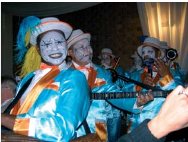
▼ Slika 1. Capetonian minstrels – Minstreli Cape Town-a

40 kraćih prezentacija koje je odabrao znanstveni odbor kongresa između pristiglih postera, kojih je prikazano 261.