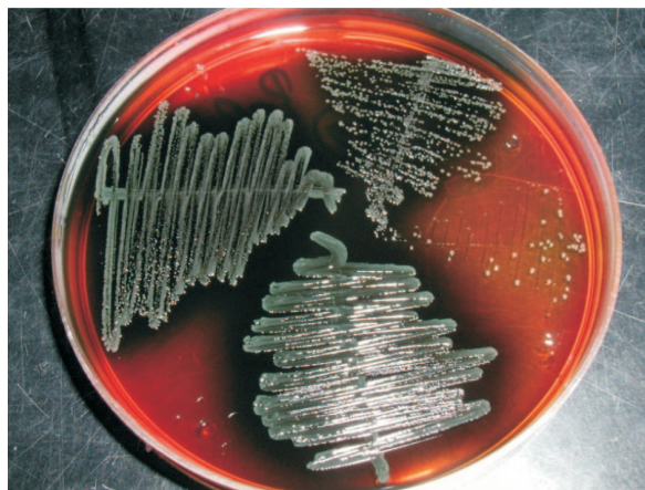
Slika 2: Kolonije L. monocytogenes izolirane iz vrhnja od sirovog mlijeka, porasle na Palcam agaru Figure 2: L. monocytogenes colonies on Palcam agar, isolated from raw milk cream

vog mlijeka. Prema navedenom pravilniku, propisani su ovi standardi: