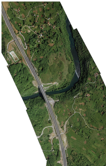
Slika 3. Otok na Dobri - DOF (M 1:5000)

U slučaju da prostorno planska dokumentacija nije u skladu sa zahtjevima budućeg korisnika prostora, koji mora imati realne osnove, potrebna je izmjena prostornih planova. Izmjena prostornih planova ne radi se samo radi plinovoda, nego i radi izgradnje novih prometnica, dalekovoda, povećanja građevinskih zona itd. U slučaju da je potrebna izmjena prostornih planova gradova ili općina to uvjetuje i izmjenu Županijskog plana kao plana višeg reda. U stvarnosti to znači da moraju proći prethodne i javne rasprave za Županijski