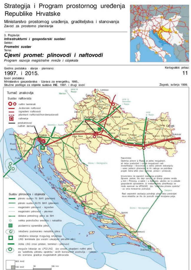
Slika 1. Strategija i Program prostornog uređenja Republike Hrvatske