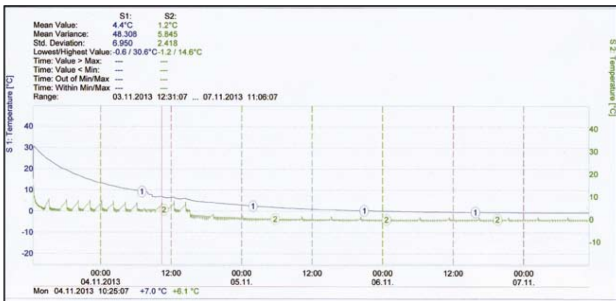
▼ Slika 3. Krivulja hlađenja juneće polovice (but, mjerenje br. 1)