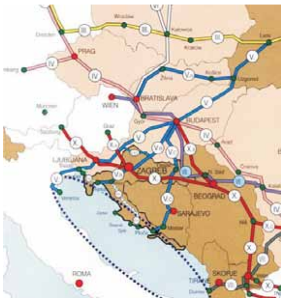
Slika 4. Paneuropski prometni koridori

Glavni željeznički koridori prate sve glavne europske koridore te uz željezničku prugu Čakovec – Koprivnica – Osijek omogućuju primjeren pristup teretnome i putničkom prijevozu.