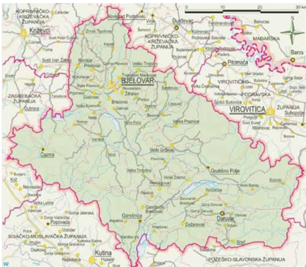
Slika 1. Temeljna cestovna infrastruktura Bjelovarsko-bilogorske županije

Izgradnjom višenamjenskog kanala Dunav – Sava od Vukovara do Šamca i kanaliziranjem Save od Šamca do Siska te izgradnjom nove dvokolosiječne pruge