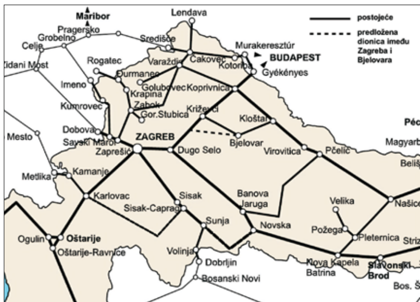
Slika 2. Željezničke pruge središnje Hrvatske

Zračne veze toga prostora ostvaruju se prije svega preko Zagrebačke zračne luke i ostalih hrvatskih zračnih luka te Budimpešte, Graza, Beča i Ljubljane.