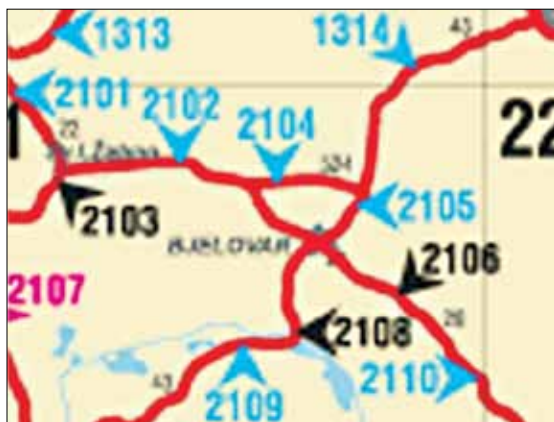
Slika 5. Položaj brojačkih mjesta na državnim cestama