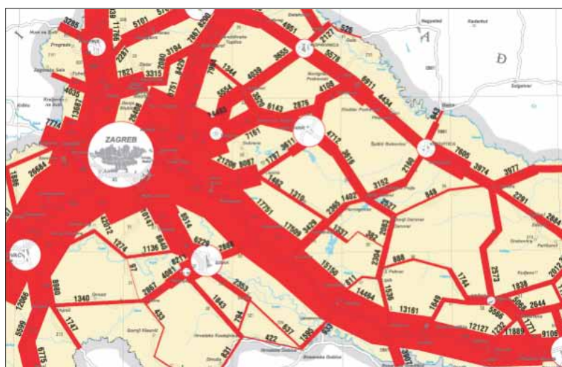
Slika 6. Opterećenja prometne mreže središnje Hrvatske i Bjelovarsko-bilogorske županije

90% vrlo malim tehničkim zahvatima i izmjenom okoline vozača. U gradskoj uličnoj mreži mogu se izbjegavanjem nepotrebnih presijecanja uz neznatna ulaganja često potpuno otkloniti uska grla u prometu. Znanost u Hrvatskoj je u tim disciplinama u vrhu svjetske znanosti.