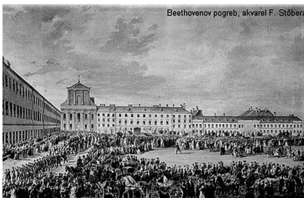
Beethovenov pogreb, akvarel F. Stöbera

Analize Beethovenove kose provedene (L. H. Reiter, W. Walsh) pokazale su da je bio izložen trovanju olovom u vrijeme smrti [12], ali analiza lubanje je pokazala da je trovanje trajalo dulje. Otrovanje olovom može izazvati glavobolju, umor, probleme s koncentracijom i druge zdravstvene probleme. Također bi moglo objasniti Beethovenovo loše ponašanje, ljutnju i nesklonost suradnji. Kako je olovo došlo u organizam Ludwiga van Beethovena? Ovdje ćemo navesti tri moguća načina. Kako je Beethoven volio piti, posebice vino, moguće je da se pod ujecajem kiseline iz vina oslobađalo olovo iz olovne glazure glinenih vrčeva i preko probavnog sustava ušlo u organizam [10, 12, 13]. Druga opcija jest da je Beethoven otrovan olovom iz olov-