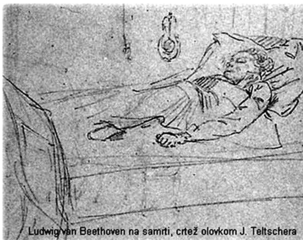
Ludwig van Beethoven na samti, crtež olovkom J. Teltschera

Beethovenova jetrena bolest javlja se početkom 1821. godine [4, 10, 11]. Od ožujka se loše osjeća, vezan je za krevet, ima mučninu i jače reumatske smetnje. Polovicom godine javlja se žutica koja traje tjednima. Tek u rujnu može nastaviti liječenje u toplicama. 1825. godine počinje povraćati krv (hematemeza) i krvari iz nosa (epistaksa). Smetnje pokušava liječiti alkoholom, ali uviđa da mu to ne koristi. Već od prije tridesetak godina zbog depresije uzrokovane naglušošću sklon je alkoholu. Pije ga stotinjak grama dnevno, najčešće oko litru vina. Dapače ga izdavači nota mite većim pošiljkama butelja njegovih omiljenih vina, a neke mu pošiljke zbog smrti nisu mogle biti uručene. Volio je šampanjac, punč i pivo, koje je navečer u gostionicama obilno pio. Često se opijao i tada bio osobito neugodan okolini. Smatra se da i manje količine alkohola od spo-