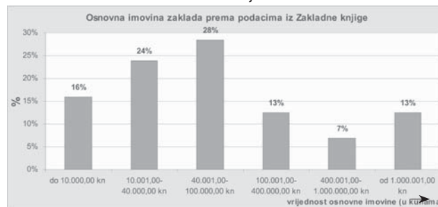
Grafikon 3. Osnovne imovine zaklada u Hrvatskoj

Podaci iz grafikona 3. govore da većina Hrvatskih zaklada ima malu osnovnu imovinu. Čak 68% zaklada ima osnovnu imovinu do 100 000 kuna. Dakle, mali broj zaklada ima imovinu čijim se iskorištavanjem mogu ostvariti prihodi za financiranje programa rada zaklade. Očito je uglavnom riječ o zakladama koje prikupljaju sredstva za svoj rad ( fund raising foundation ).