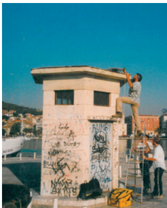
Slika 2. GPS-mjerenja na GPS-točki 1. reda Mareograf Split.