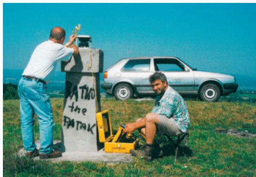
Slika 1. GPS-mjerenja na GPS-točki 1. reda Brusnik (EUREF).

GPS-kampanja održana je od 30. svibnja do 3. lipnja 1994. godine. Obuhvaćeno je ukupno 26 točaka, od toga 11 u Sloveniji i 10 u Hrvatskoj, te 3 referentne IGS (International GPS Service) točke i 2 kontrolne IGS-točke. Na svakoj točki mjerene su 4 sesije u trajanju po 24 sata. U RH opažane su sljedeće točke: Brusnik (slika 1), Velika Kapanica, Donji Miholjac, Gradište, Novoselsko Brdo, Ilin Vrh, Sveti Ivan, Pula, Žirje i Hvar. Izjednačenje mreže GPS-točaka obuhvaćenih kampanjom obavljeno je u sustavu ITRF92 (International Terrestrial Reference Frame) u epohi mjerenja 1994.4. Korištena je statička relativna metoda pozicioniranja (Bačić i Bačić 1998) dvofrekventnim GPS-prijamnicima. Mreža je oslonjena na tri referentne IGS-točke (Graz, Matera i Zimmerwald).