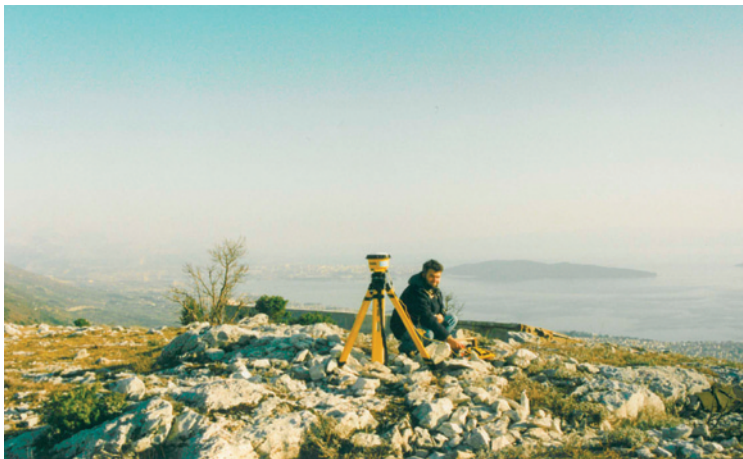
Slika 4. GPS-mjerenja na GPS-točki 1. reda Prapatnica.

Dok je za mrežu 1. reda u cijelosti preuzeta stabilizacija stare trigonometrijske mreže (slika 4), također su za te točke preuzete i Gauss-Krügerove koordinate, za GPS-mrežu 2. reda preuzeta je stabilizacija i Gauss-Krügerove koordinate samo za manji broj točaka, a za ostale je potrebno izvršiti transformaciju koordinata u Gauss-Krügerov sustav. Jedinствeni parametri za transformaciju koordinata iz sustava ETRS89 u Gauss-Krügerov sustav za cijelo područje RH imaju prevelike rezidualne (oko 0,50 metara), stoga u sklopu projekta 10-kilometarske mreže nije obavljena transformaciju koordinata u Gauss-Krügerov sustav. U skicama položaja točke upisane su približne Gauss-Krügerove koordinate zaokružene na 1 metar.