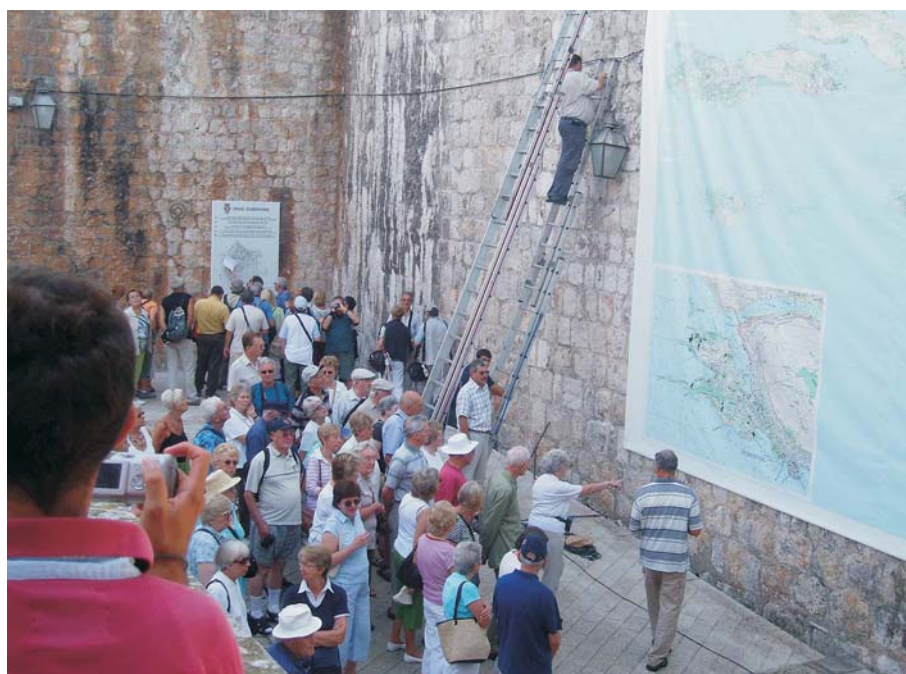
Fig. 4. Dubrovnik megamap Slika 4. Dubrovački kartozid